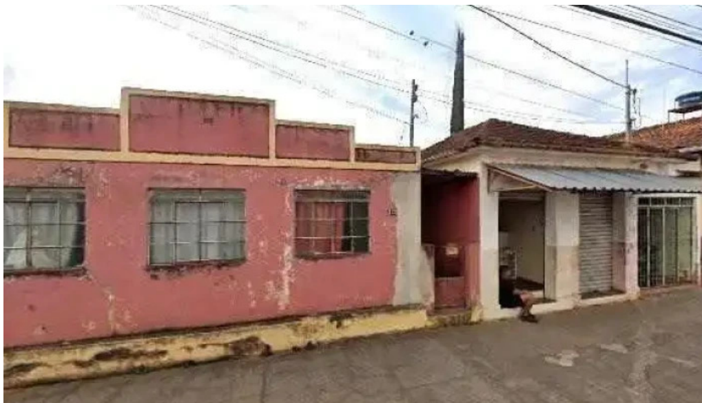
Droga minas empreendimentos farmaceuticos Ltda m tudo