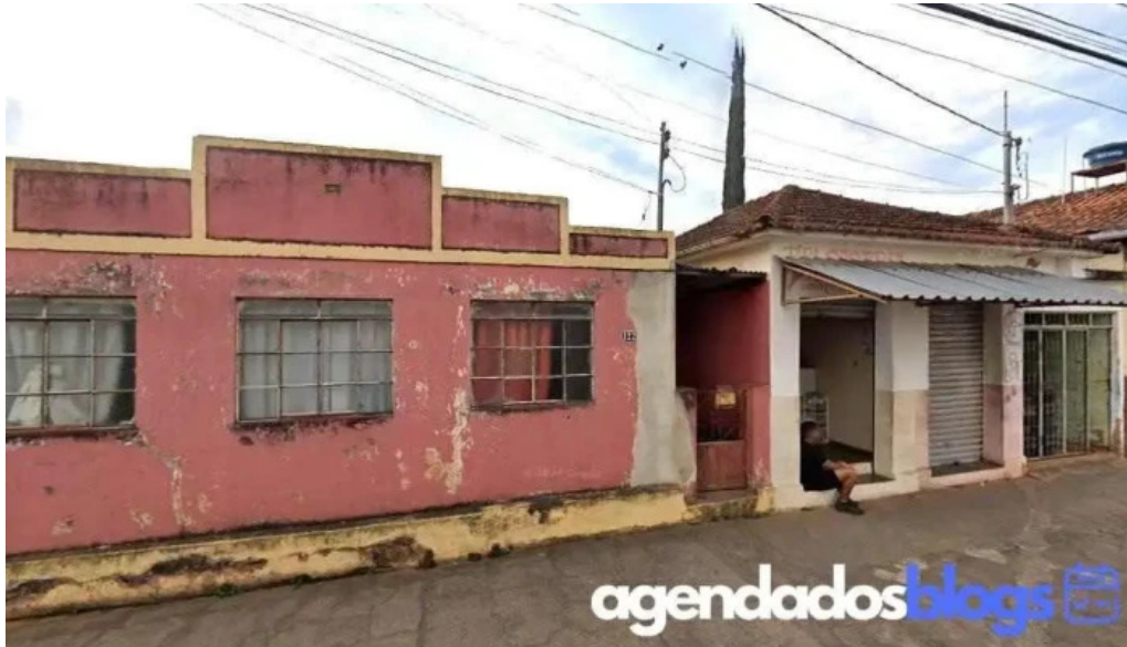
Droga minas empreendimentos farmaceuticos Ltda m andrelândia