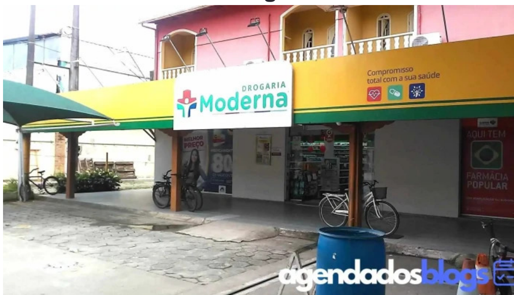
Drogaria moderna tudo