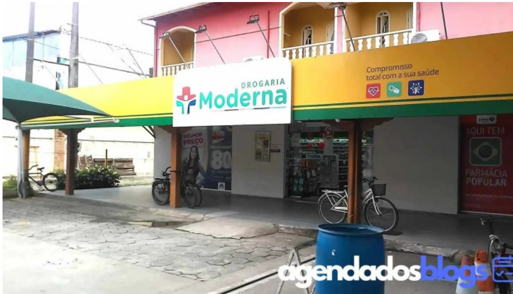
Drogaria moderna angra dos reis