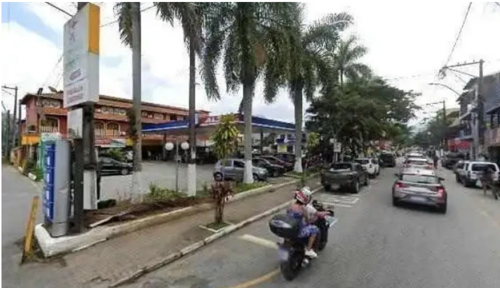
Drogaria moderna street view e 360deg