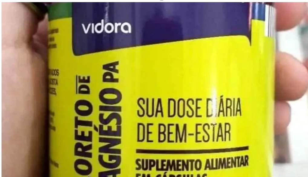
Drogaria pharma clinica tudo