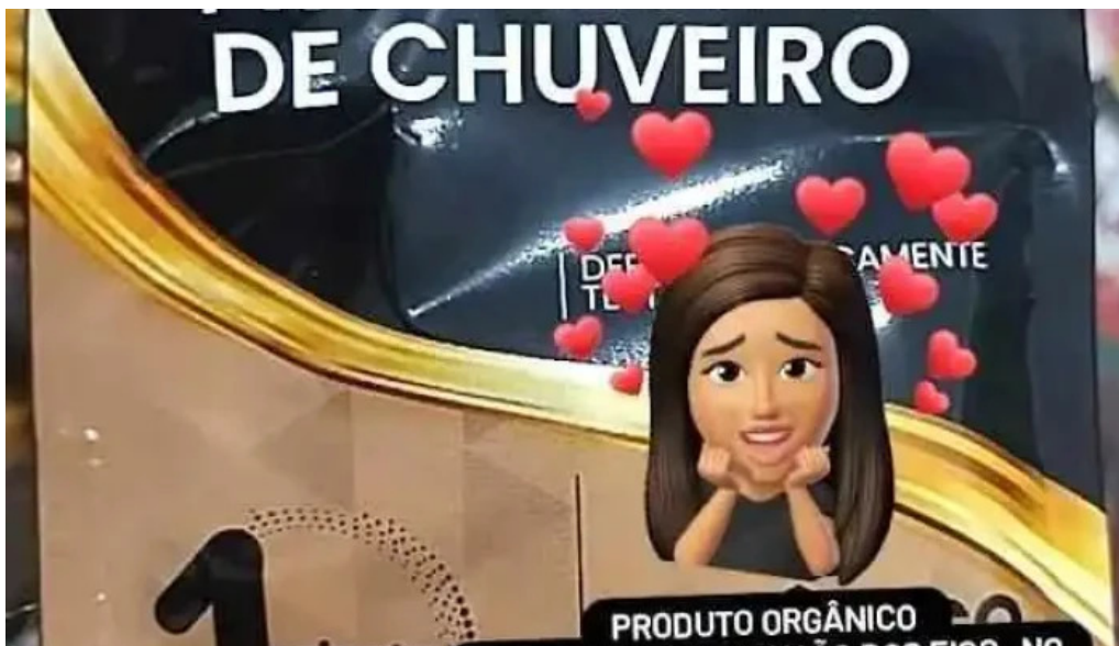
Drogaria pharma clinica angra dos reis