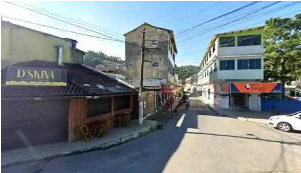
Drogaria pharma clinica street view e 360deg