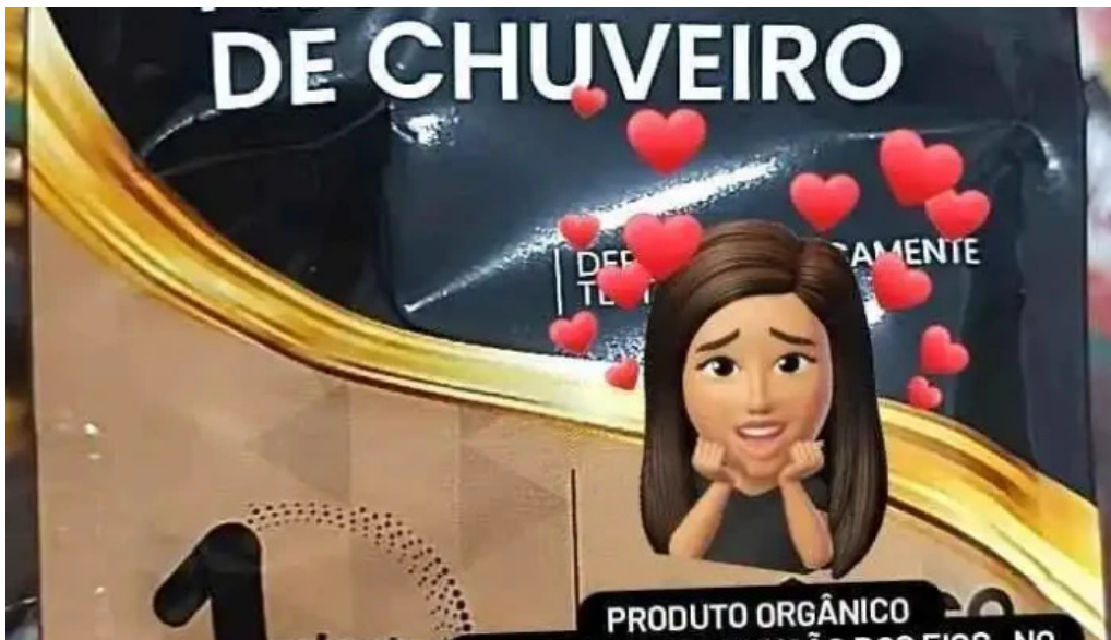
Drogaria pharma clinica do proprietario