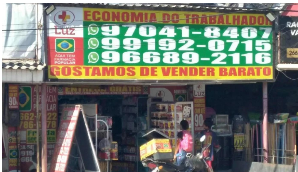
Drogaria luz belford roxo