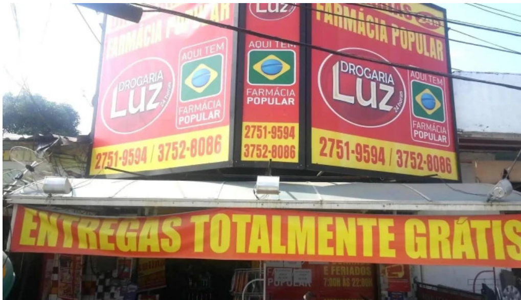
Drogaria luz tudo