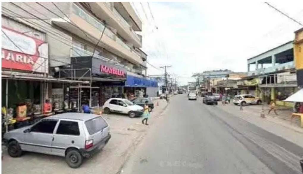
Drogaria luz street view e 360deg