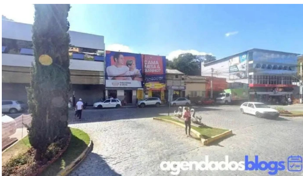
Drogarias conceito centro bom jardim