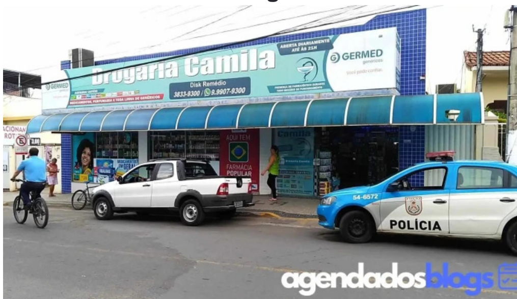
Drogueria camila tudo