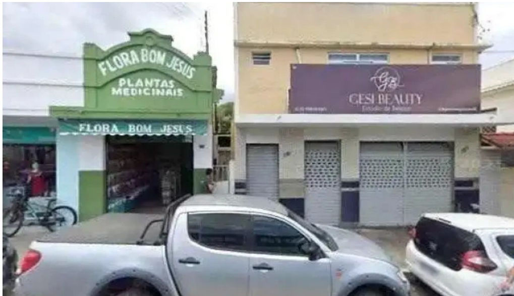
Drogaria camila street view e 360deg