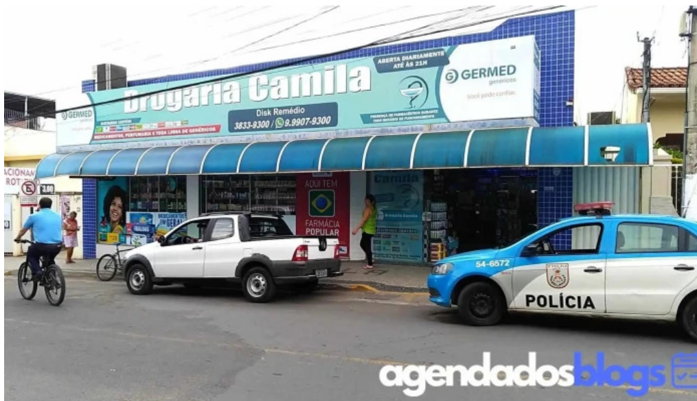
Drogaria camila bom jesus do itabapoana