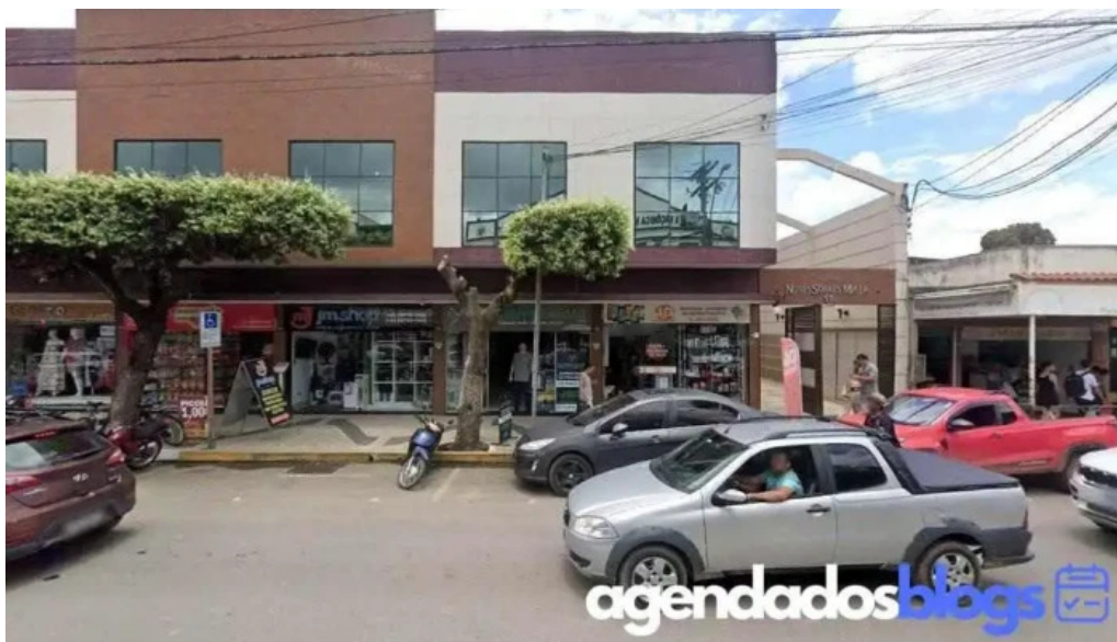
Drogaria lessa bom Jesus do Itabapoana