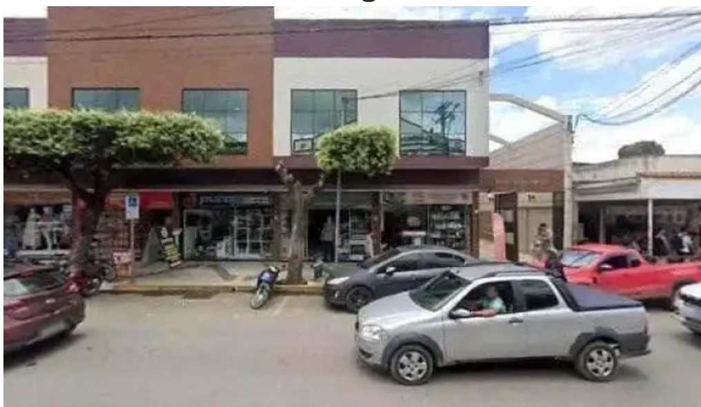
Drogaria lessa tudo