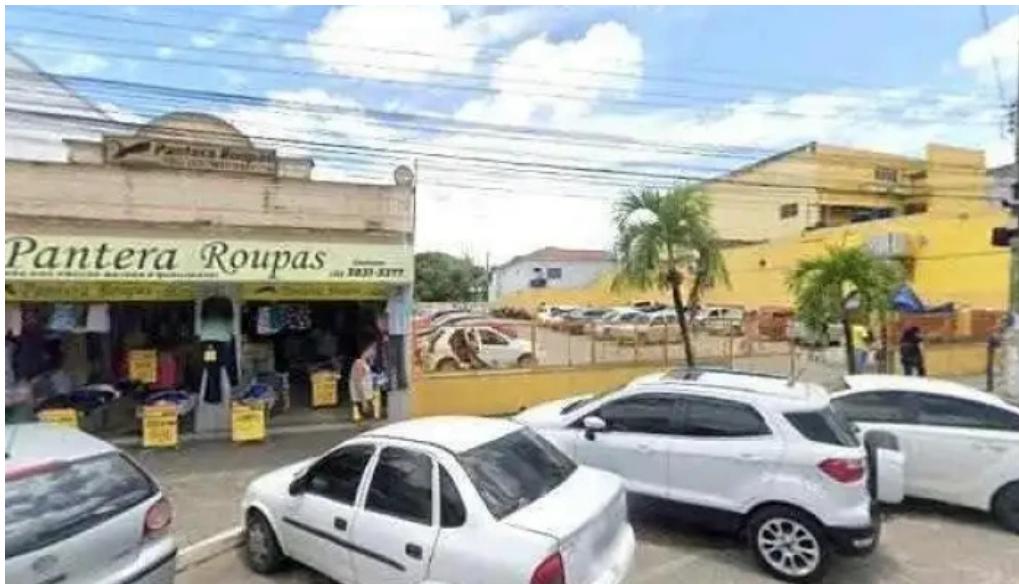
Drogaria ns carmo tudo