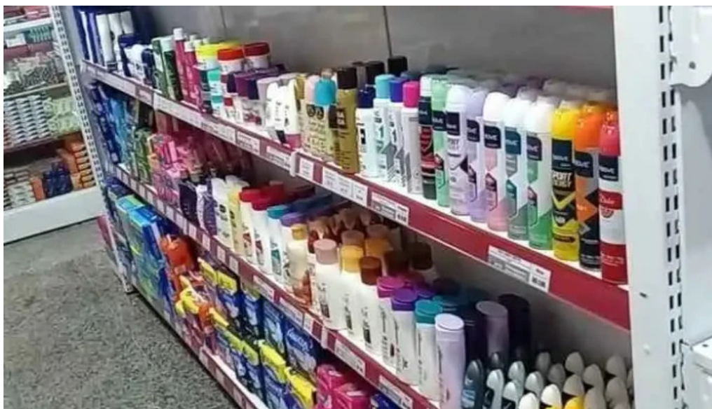
Drogaria resende do proprietario