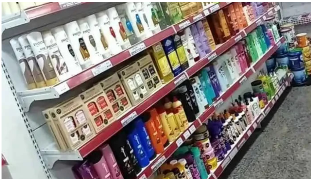
Drogaria resende tudo