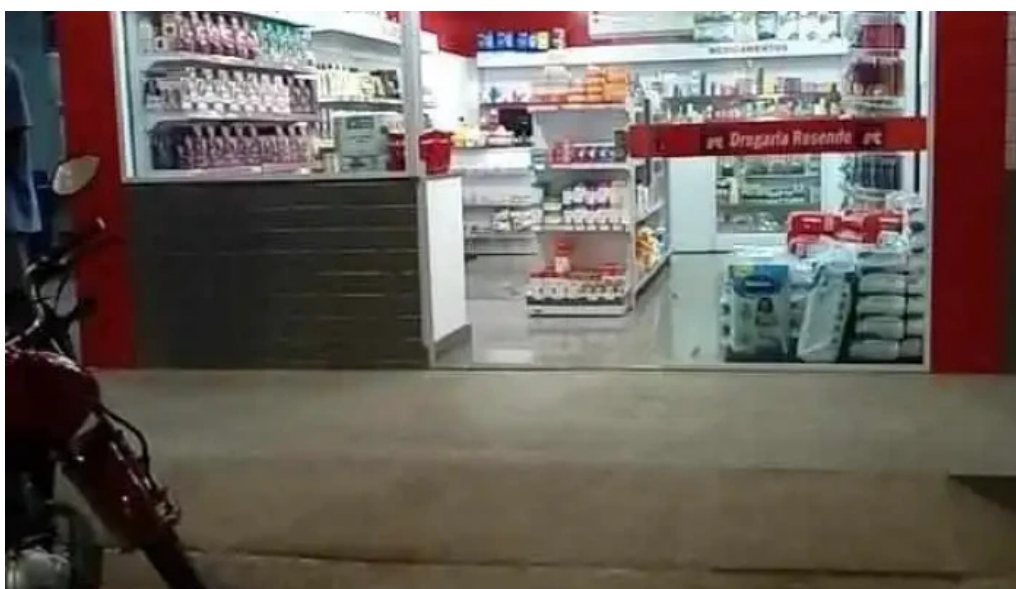
Drogaria resende bom Jesus do itabapoana