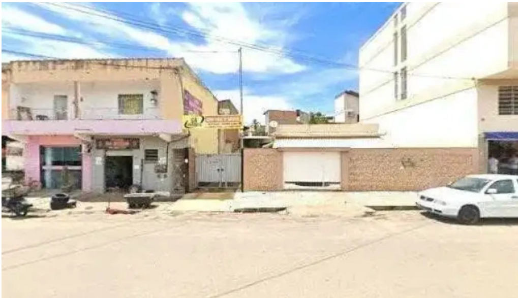
Drogaria resende street view e 360deg