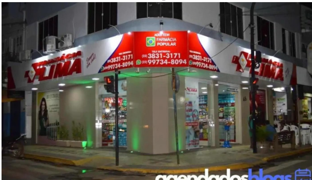
Farmacia lima tudo