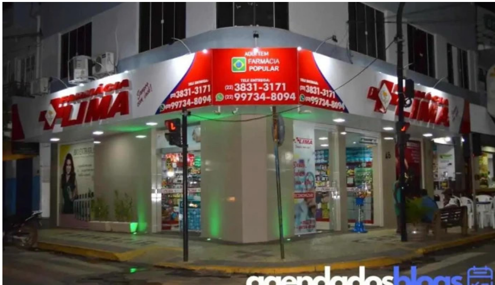
Farmacia lima bom jesus do itabapoana