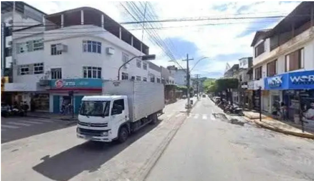
Farmacia lima street view e 360deg