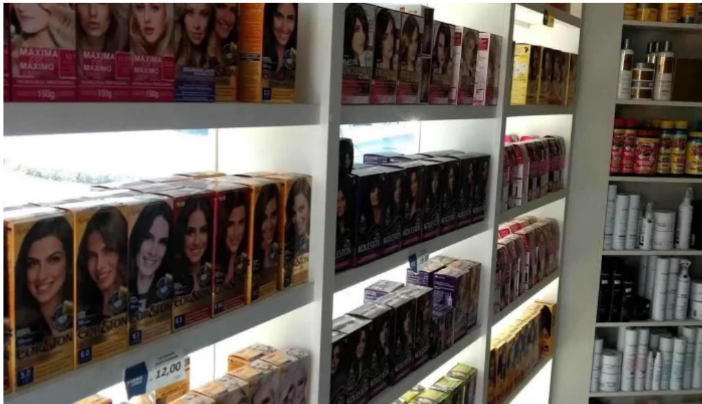
Drogaria farmaevida loja 2 do proprietario