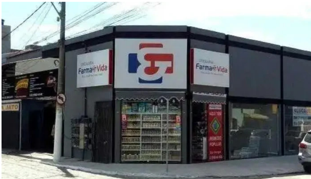
Drogaria farmaevida loja 2 cabo frio