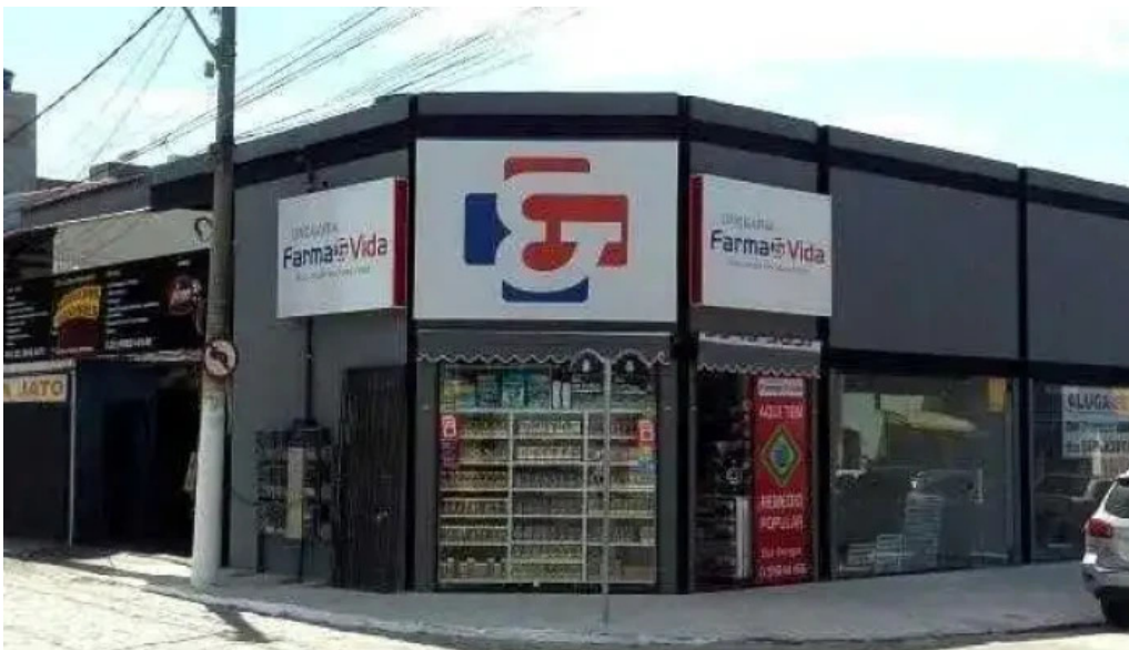
Drogaria farmaevida loja 2 tudo