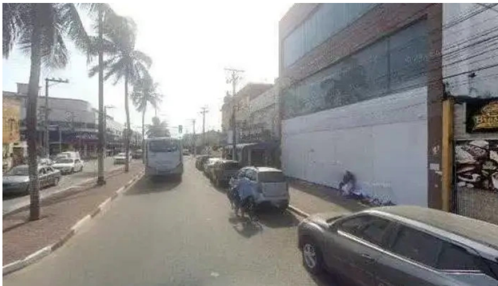
Drogaria sao cristovao willimed comercial de medicamentos street view e 360deg