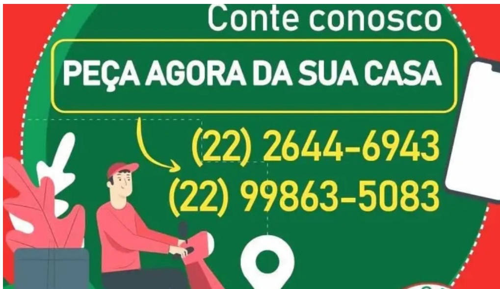
Drogaria sao cristovao willimed comercial de medicamentos tudo