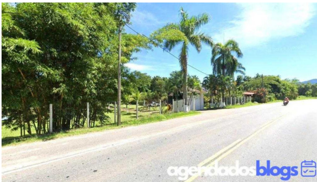
Drogaria japuiba cachoeiras de macacu