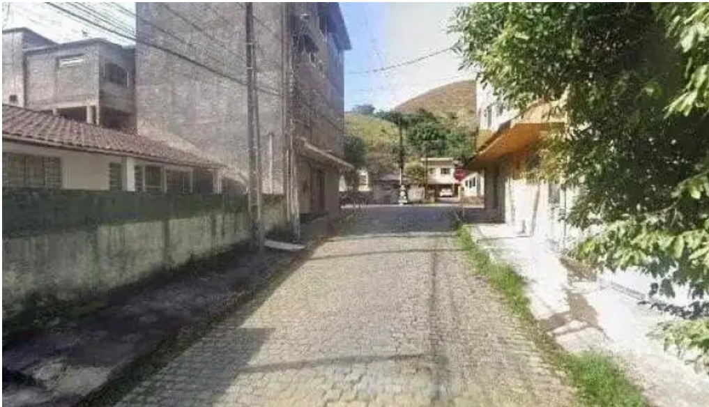
Farmacia sao francisco de assis de macacu ltda tudo