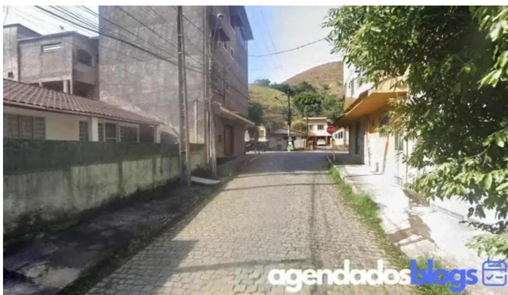
Farmacia sao francisco de assis de macacu Ltda cachoeiras de macacu