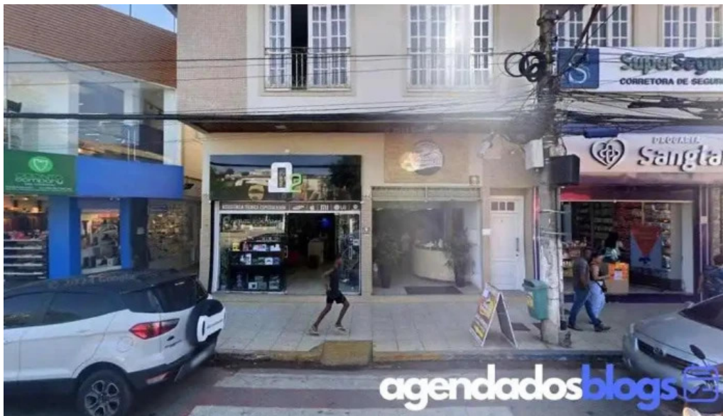
Farmacia regional de cordeiro Ltda cordeiro