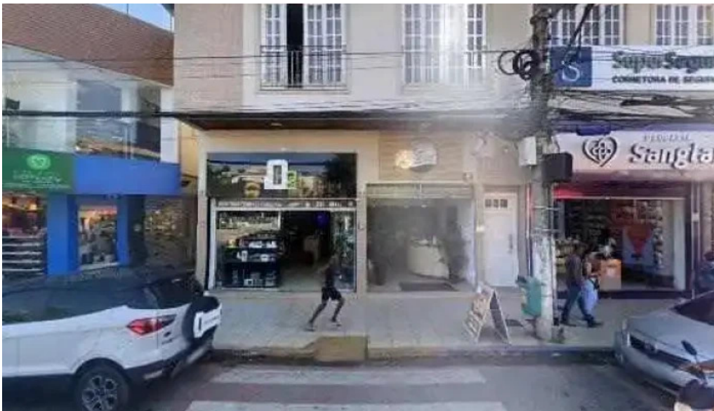
Farmacia regional de cordeiro Ltda tudo