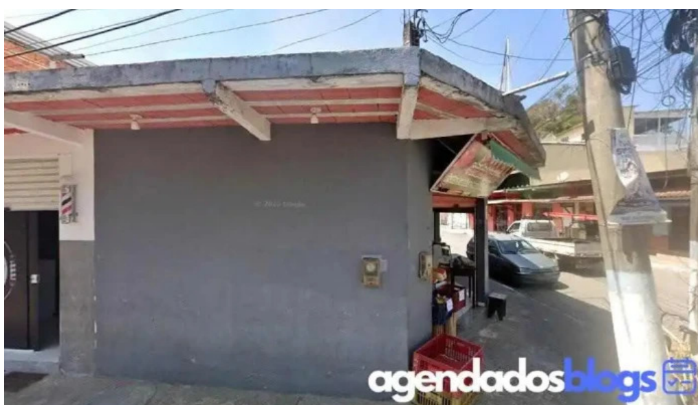
Farmacia vandabel 2005 eng paulo de frontin