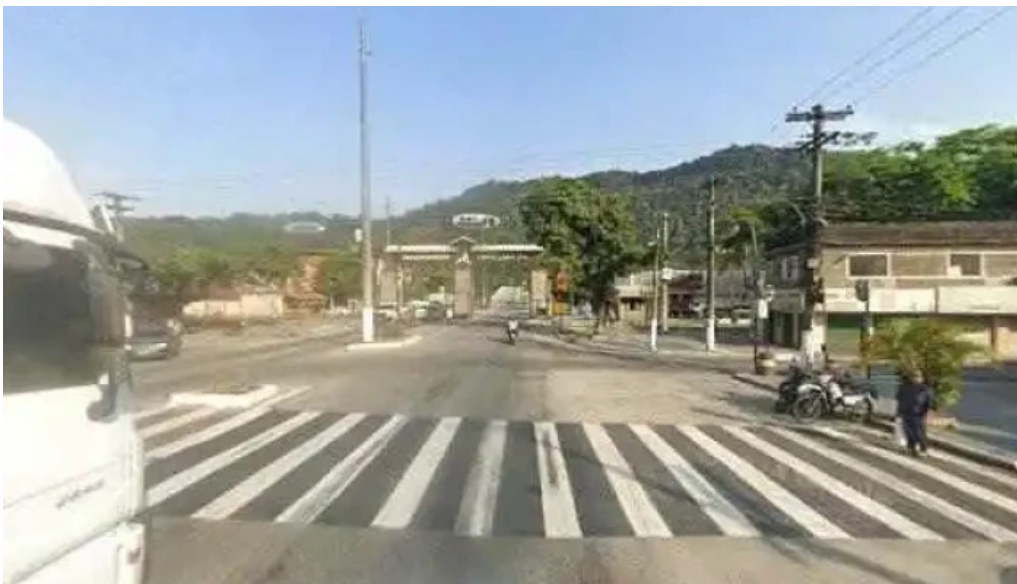
Drogaria mirim de guapi tudo