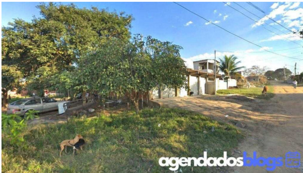
Farmacia sogedata itaborai