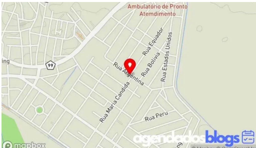
Drogaria jardim america mapa