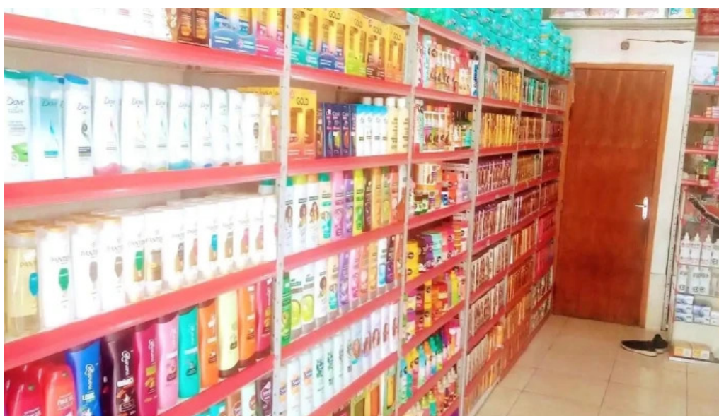
Drogaria jardim america do proprietario