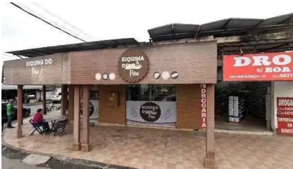
Drogaria jardim america street view e 360deg