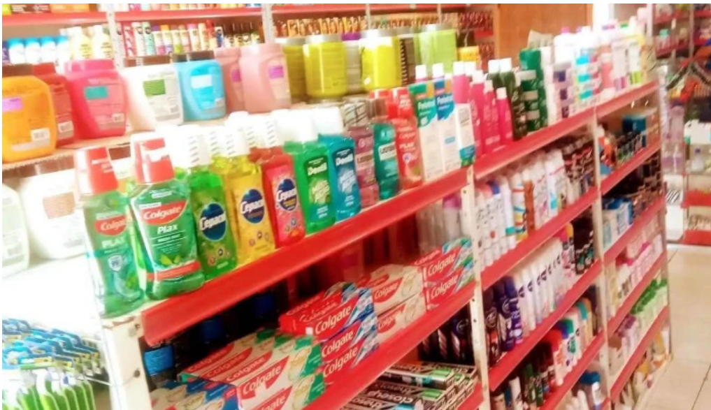
Drogaria jardim america tudo