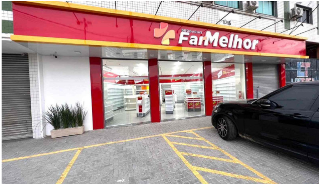
Drogarias farmelhor tudo