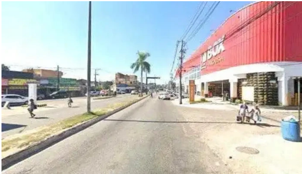
Drogarias farmelhor street view e 360deg