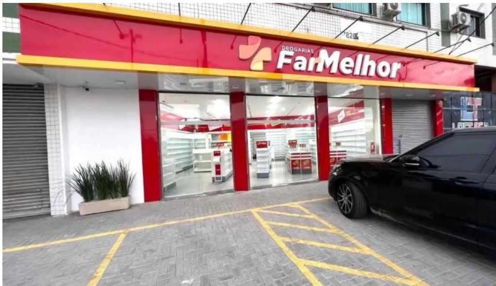
Drogarias farmelhor itaguai