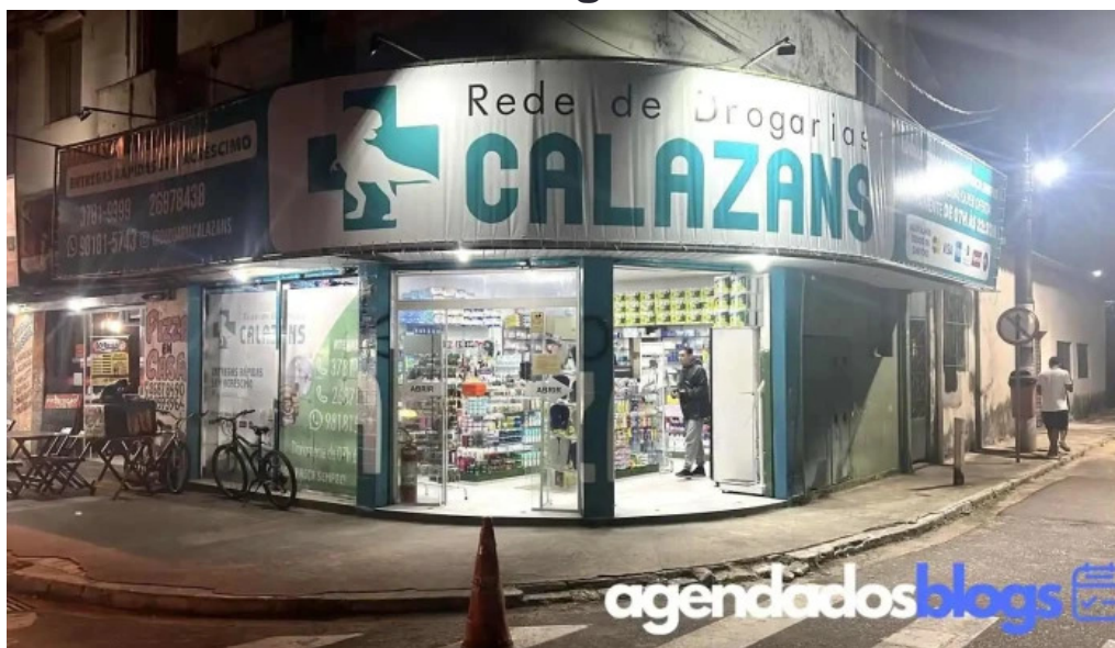
Rede de drogarias calazans tudo