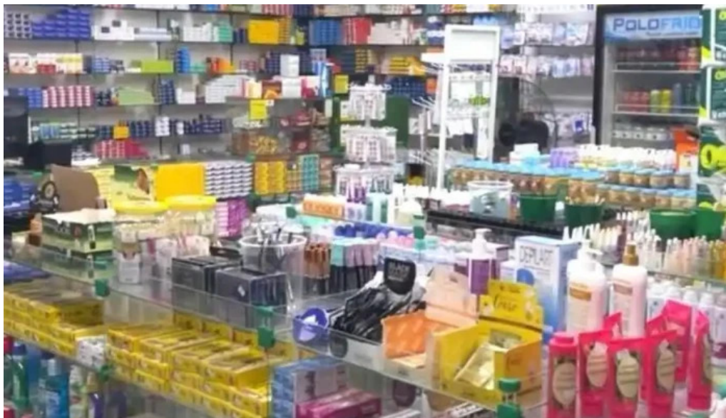
Rede de drogarias calazans do proprietario