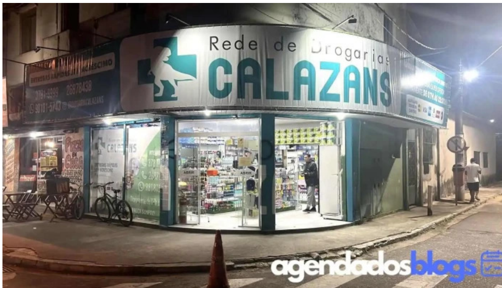
Rede de drogarias calazans itaguai