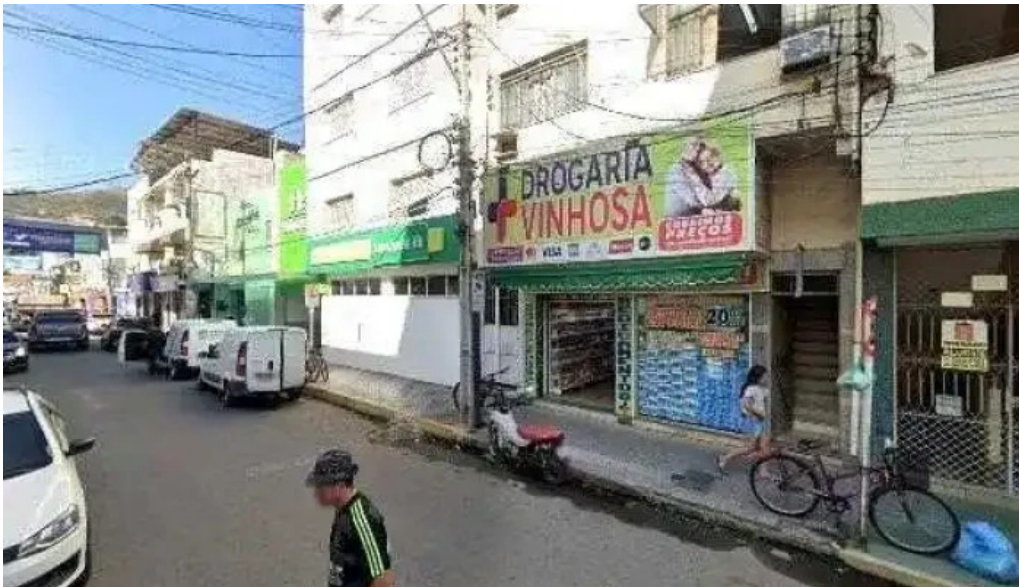
Drogaria s p itaperuna tudo