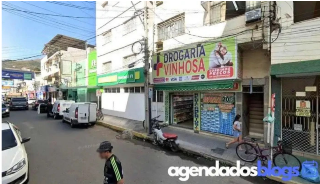
Drogaria s p itaperuna itaperuna