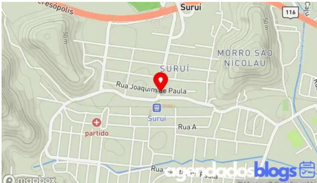
Farmacia do robinho mapa