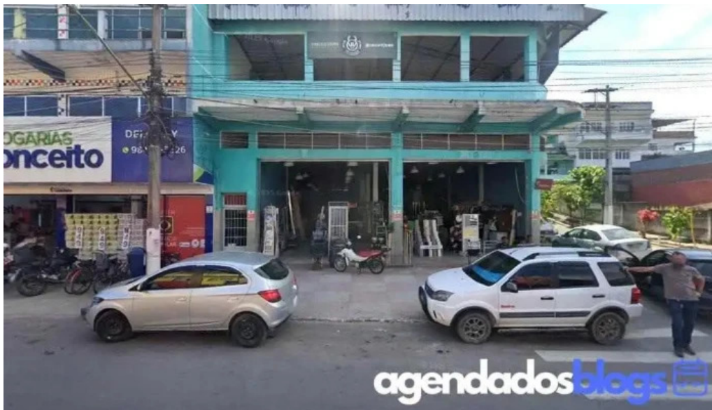
Farmacia do robinho mage