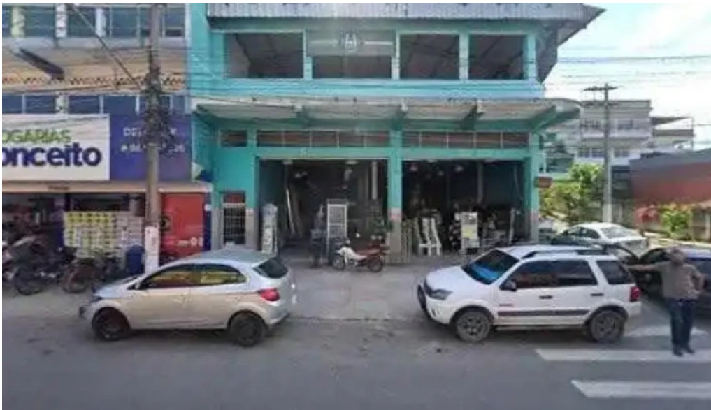
Farmacia do robinho tudo