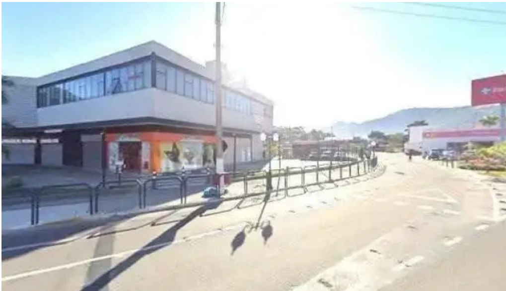
Drogarias tamoi marica medicamentos generico delivery rj street view e 360deg