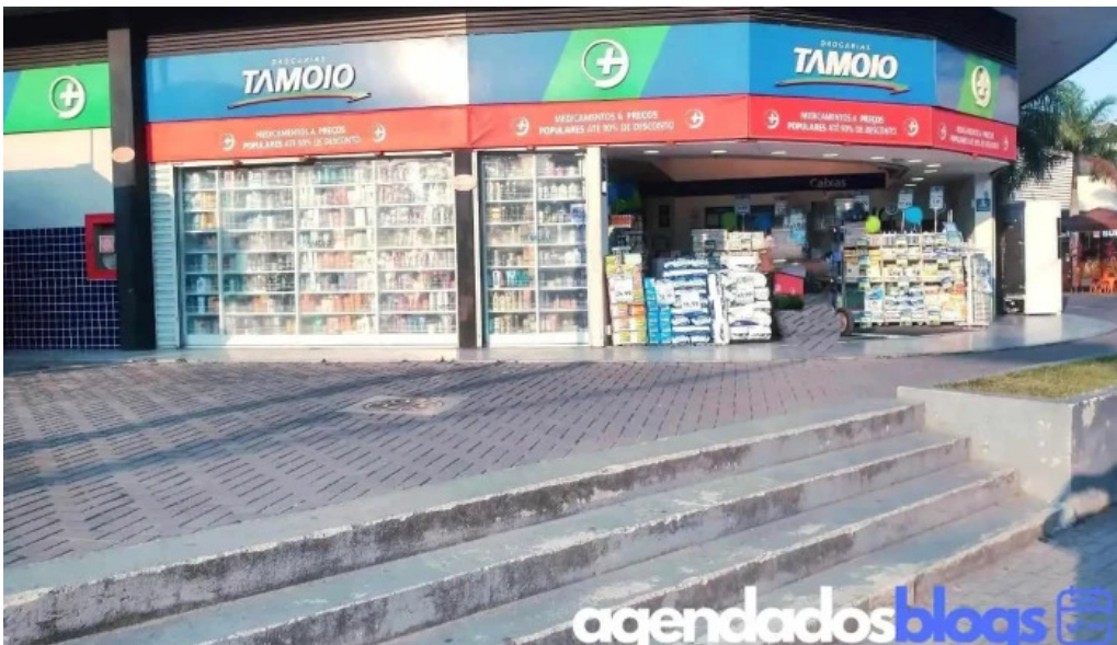
Drogarias tamoi marica medicamentos generico delivery rj marica