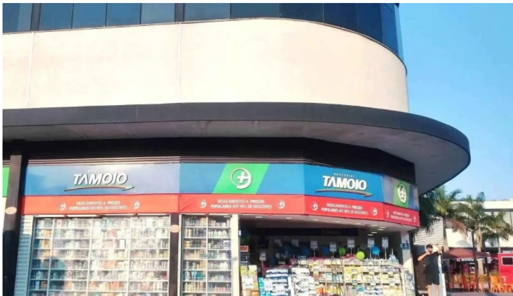
Drogarias tamoio marica medicamentos generico delivery rj do proprietario