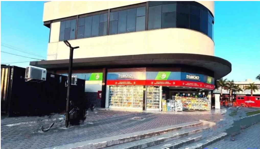
Drogarias tamoio marica medicamentos generico delivery rj tudo