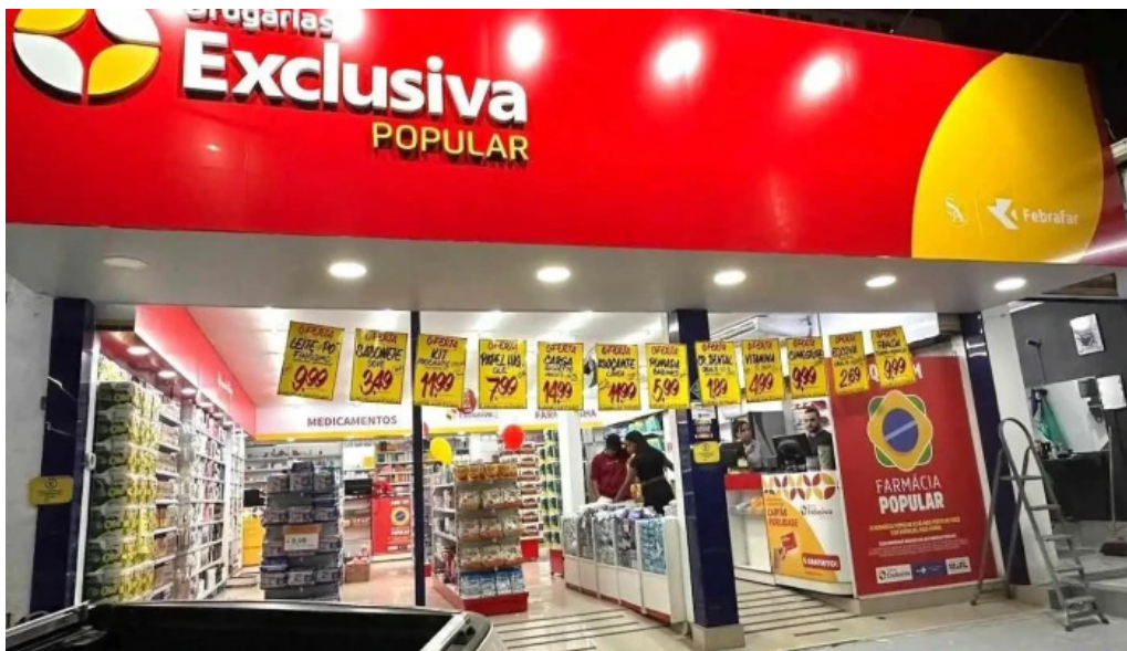
Drogarias exclusiva itamarati quissama petropolis