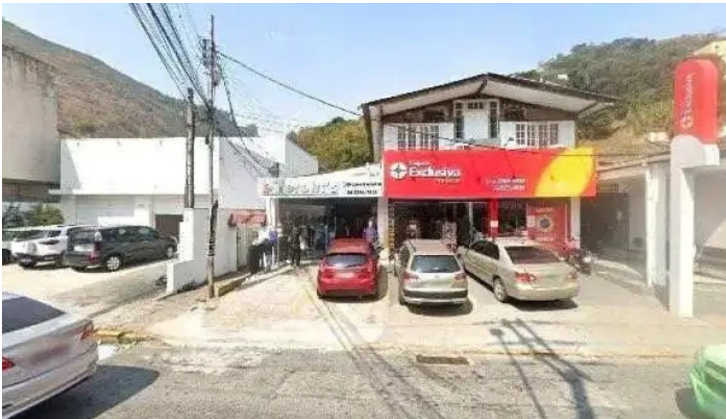
Drogarias exclusiva itamarati quissama street view e 360deg