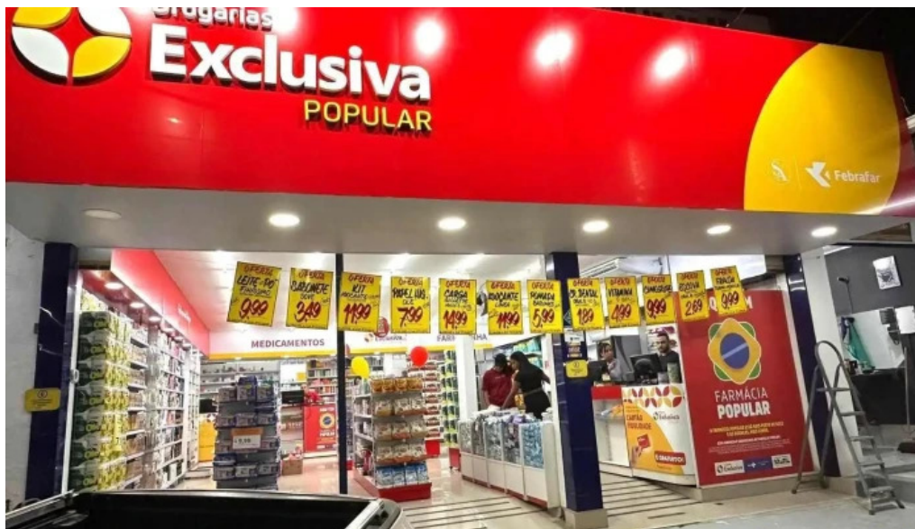
Drogarias exclusiva itamarati quissama do proprietario