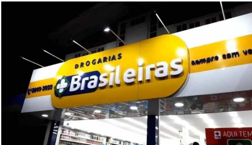
Drogarias exclusiva itamarati quissama tudo