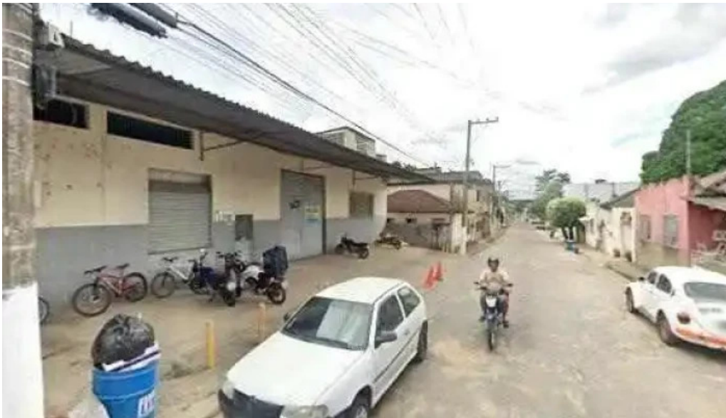
Drogeria cityfarma street view e 360deg