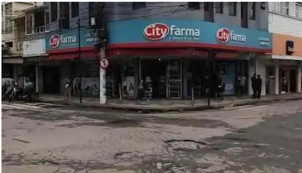
Drogaria cityfarma bom jesus do itabapoana