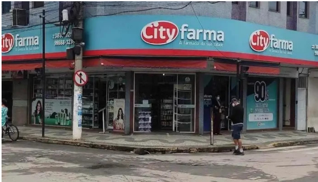
Drogaria cityfarma do proprietario