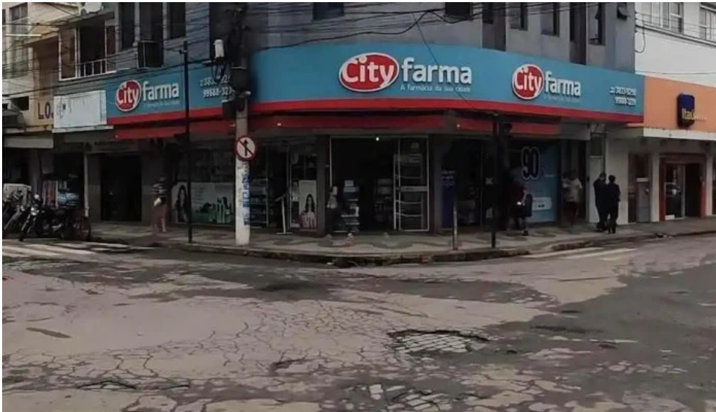
Drogaria cityfarma tudo