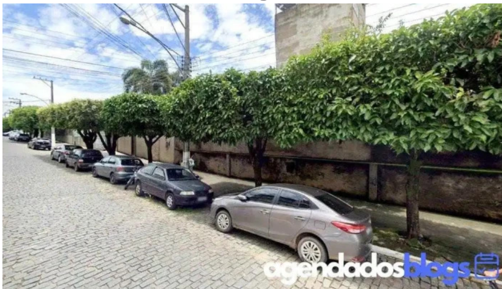
Farmacia gomes farmacia com manipulacao carmo