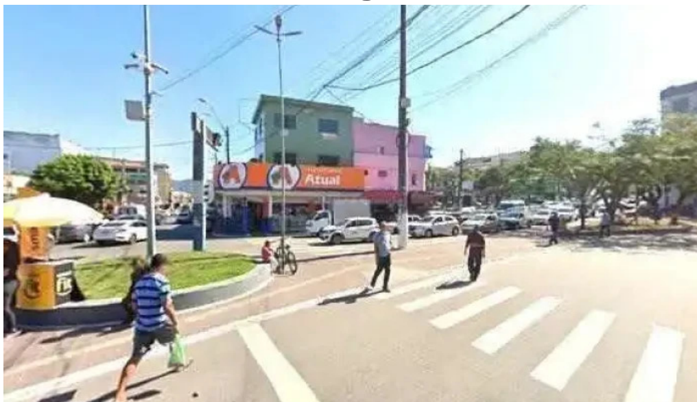
Drogaria atual loja 02 tudo