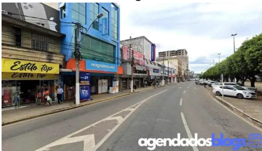
Drogaria nacional hi itaperuna centro itaperuna