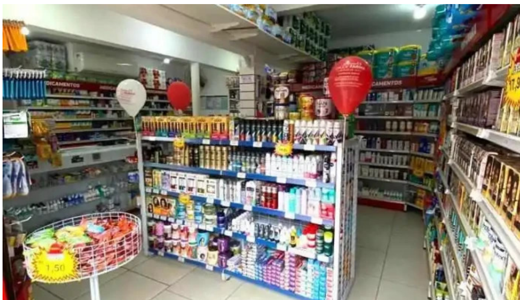
Drogaria saude farma do proprietario