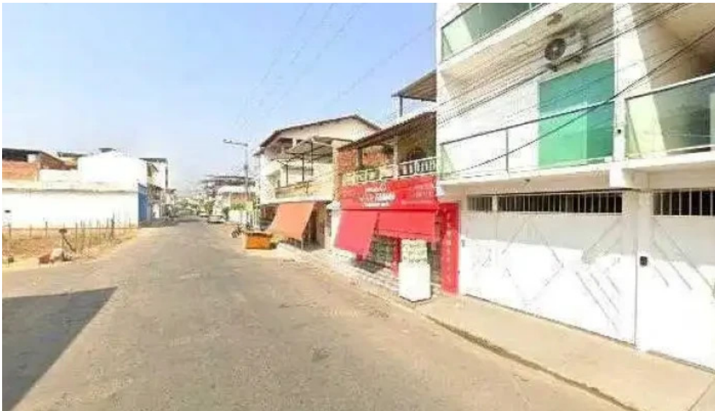
Drogaria saude farma street view e 360deg