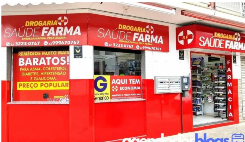
Drogaria saude farma itaperuna