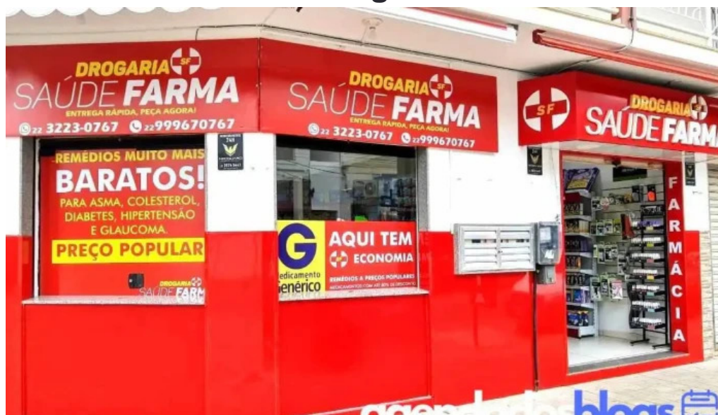
Drogaria saude farma tudo