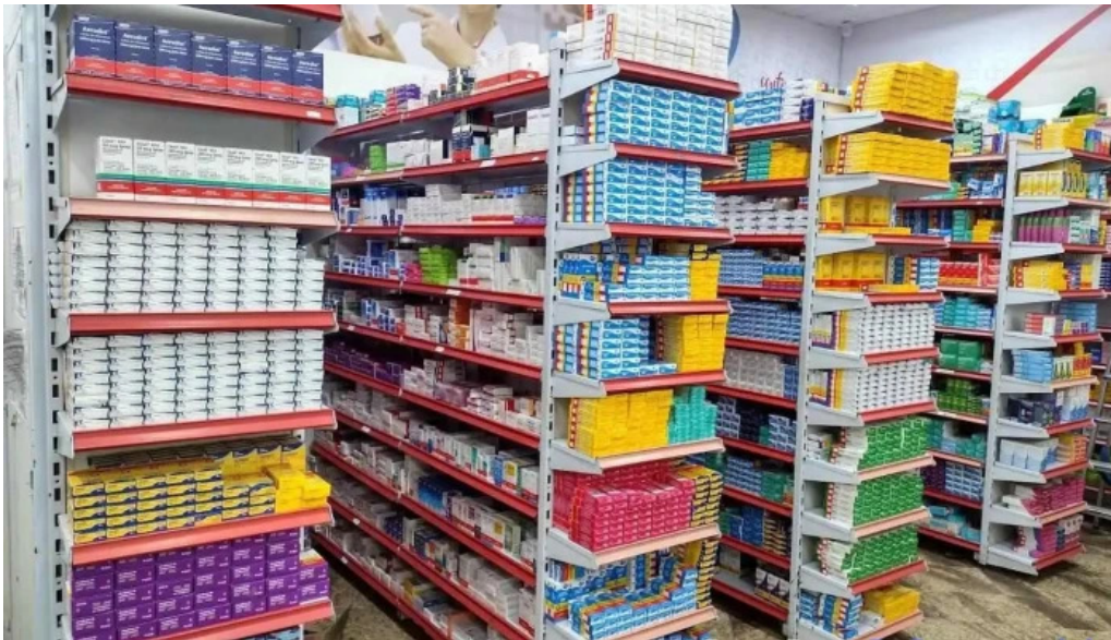
Drogaria rede popular inoa 1 marica