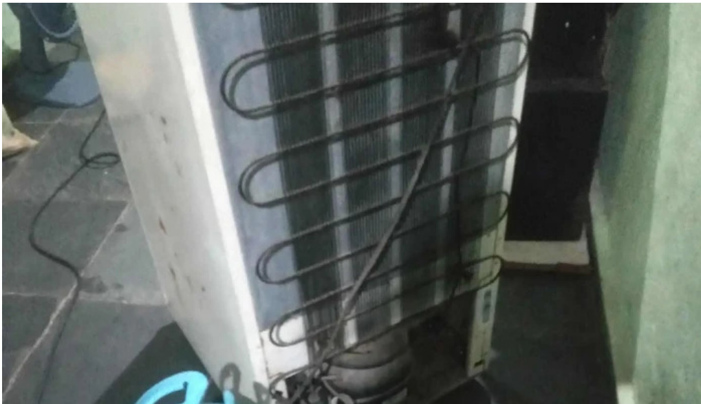
Drogaria rede popular inoa 1 marica