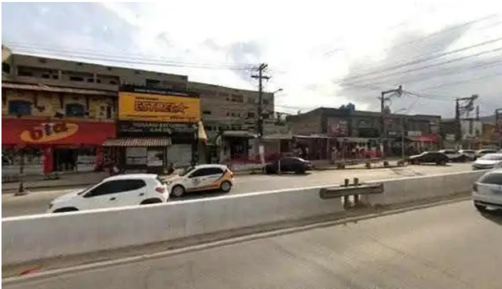
Drogaria rede popular inoa 1 street view e 360deg