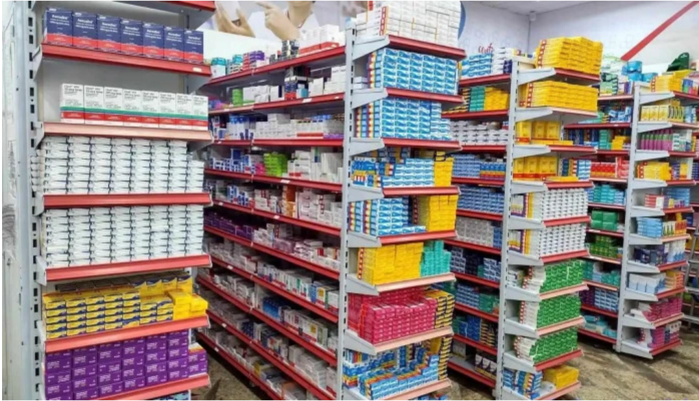
Drogaria rede popular inoa 1 tudo