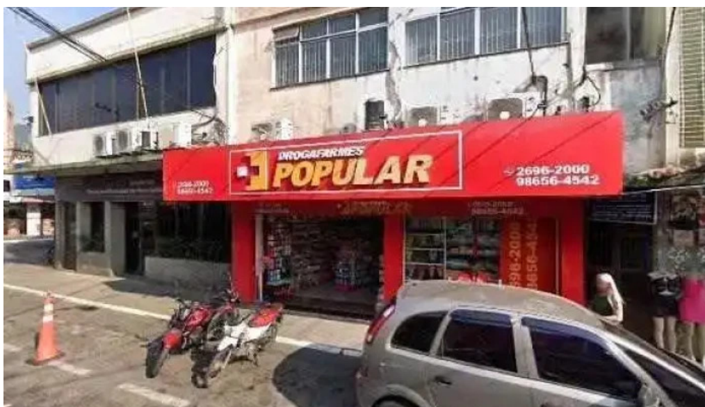
Drogafarmes popular farmacia mesquita 2 rj tudo