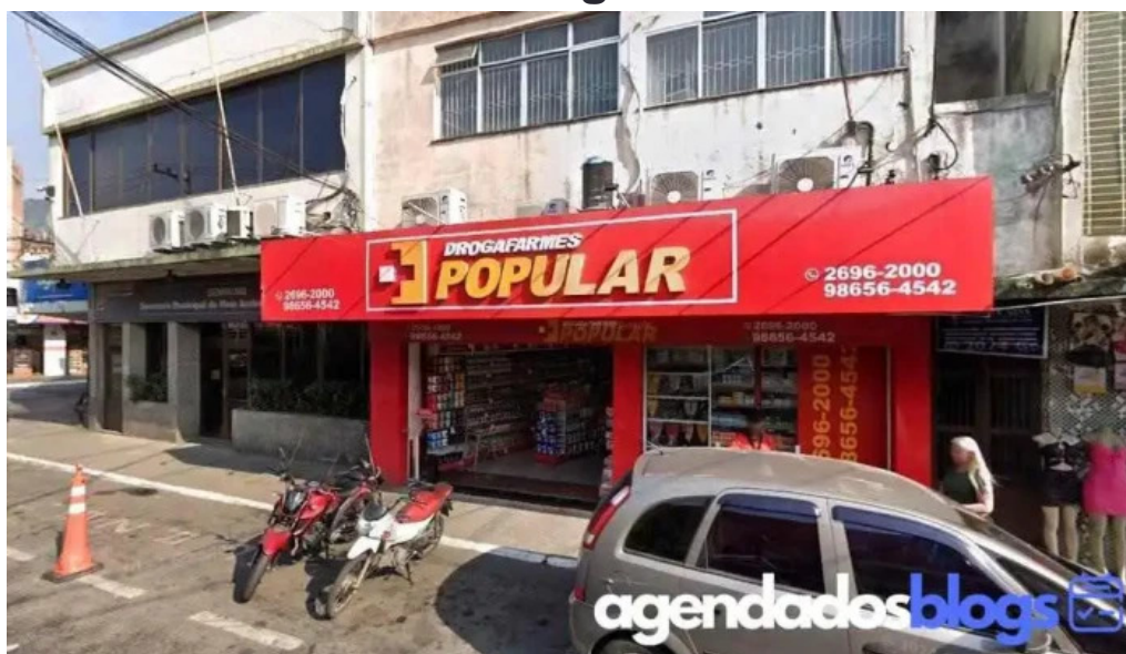
Drogafarmes popular farmacia mesquita 2 rj mesquita