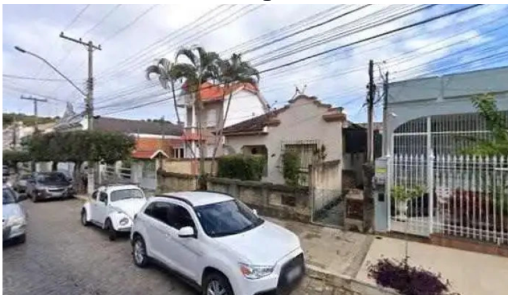
Drogaria mega popular miracema tudo