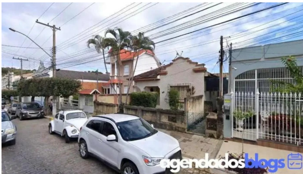
Drogaria mega popular miracema miracema