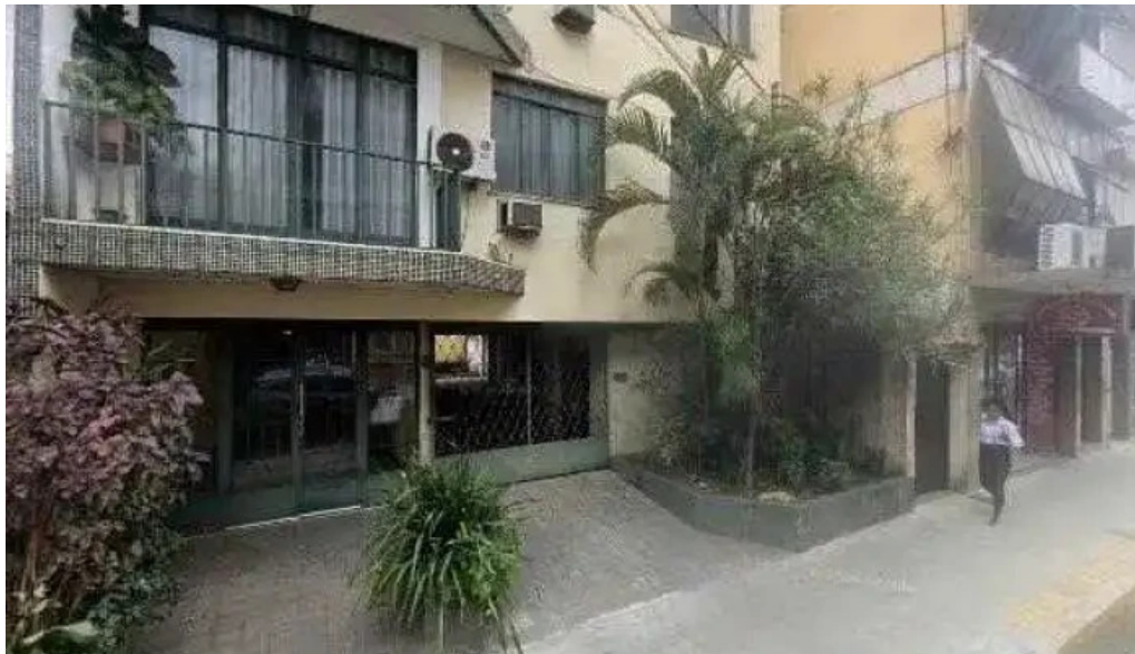
Concept pharma street view e 360deg