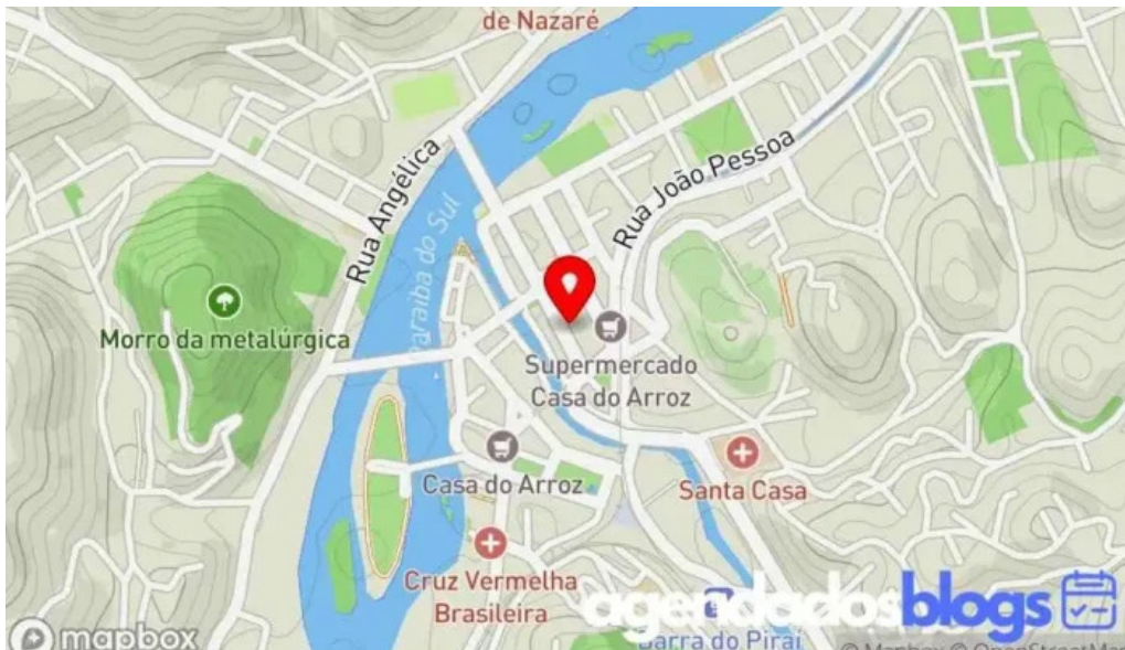
Concept pharma mapa