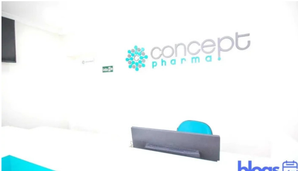
Concept pharma barra do pirai