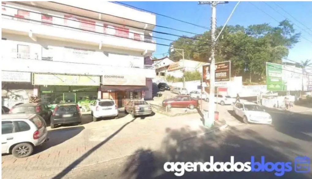
Farmacia de manipulacao cura natural marica