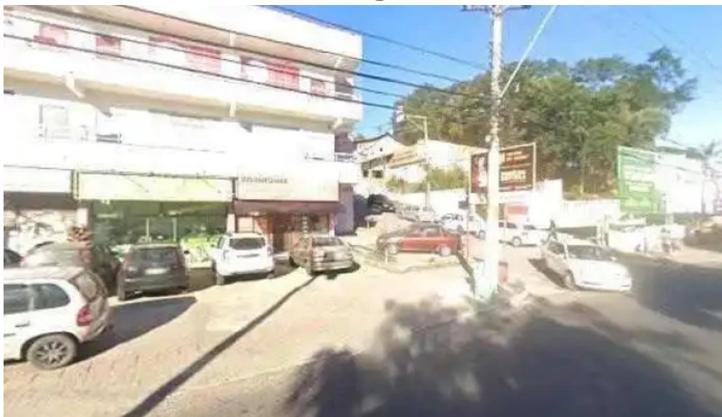
Farmacia de manipulacao cura natural tudo