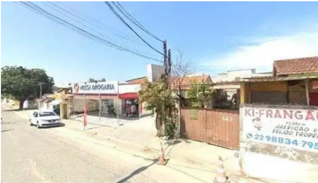
Nossa drogaria street view e 360deg