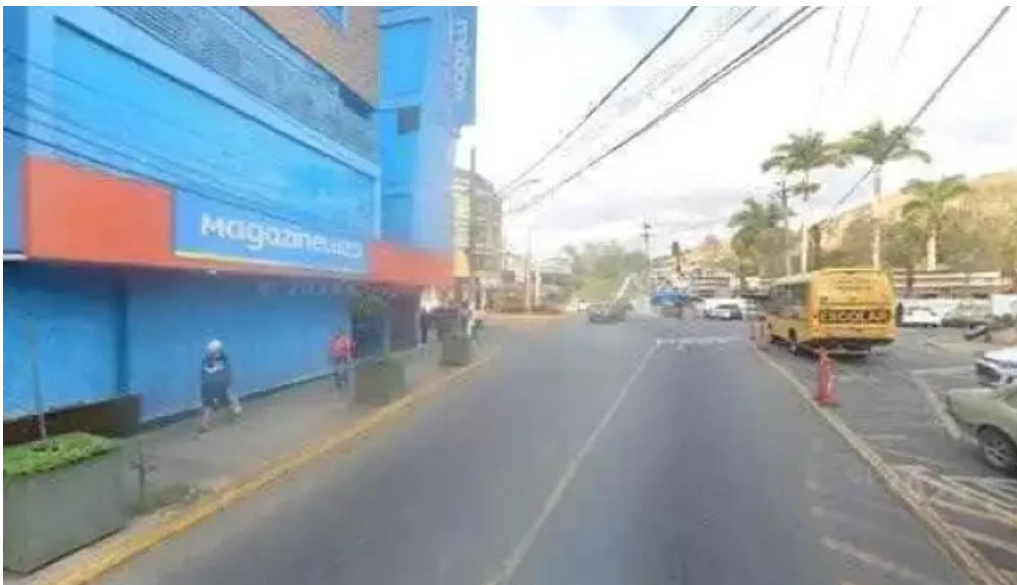
Farmacia floral homeopatia e manipulacao tudo