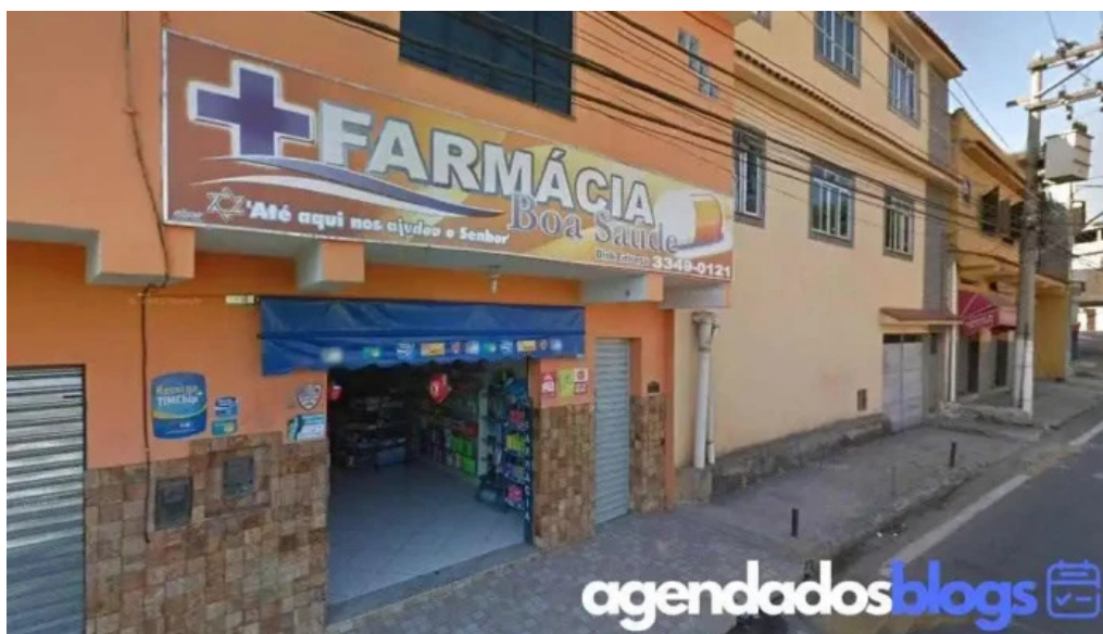
Boa saude barra mansa