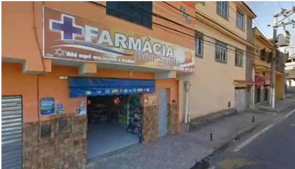
Boa saude tudo