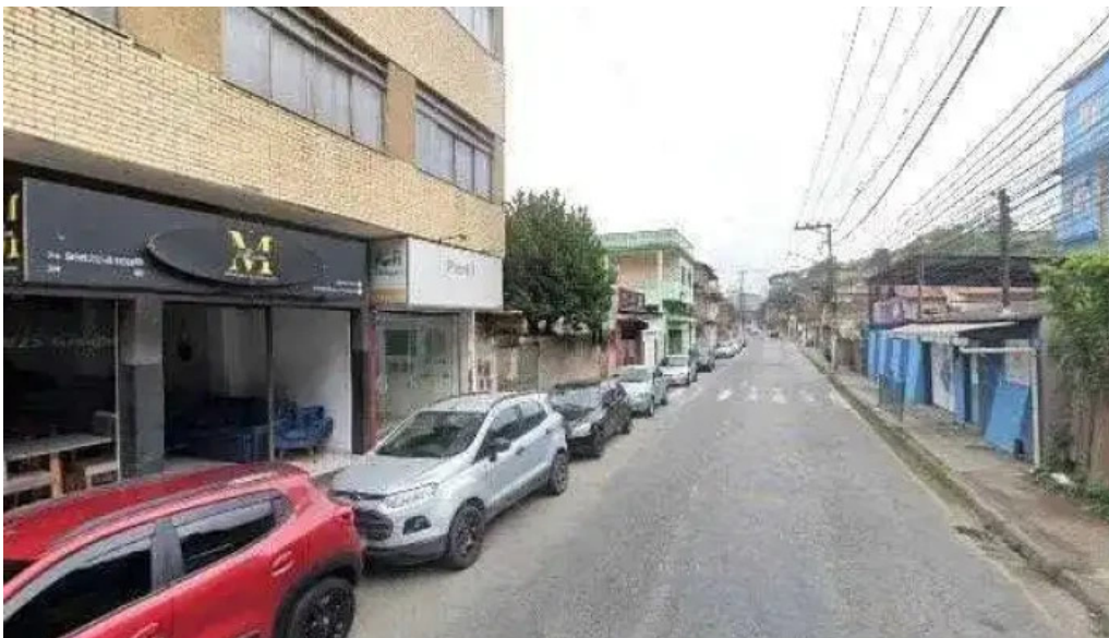
Farmacia principal de barra mansa tudo