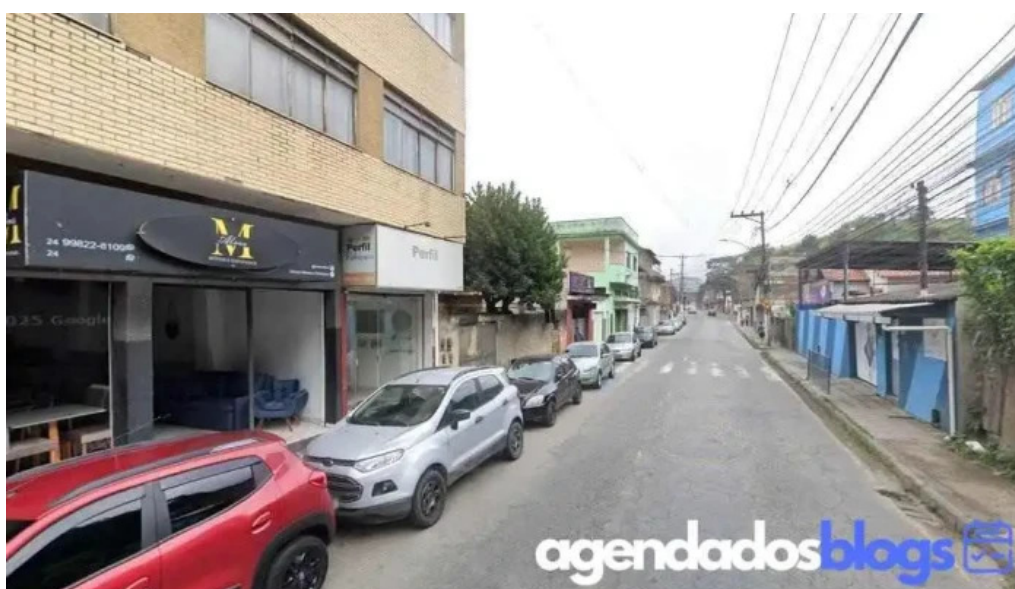
Farmacia principal de barra mansa barra mansa