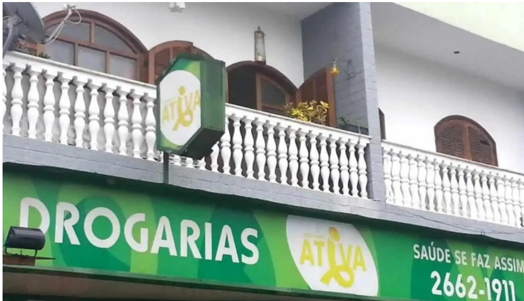
Drogaria ativa belford roxo