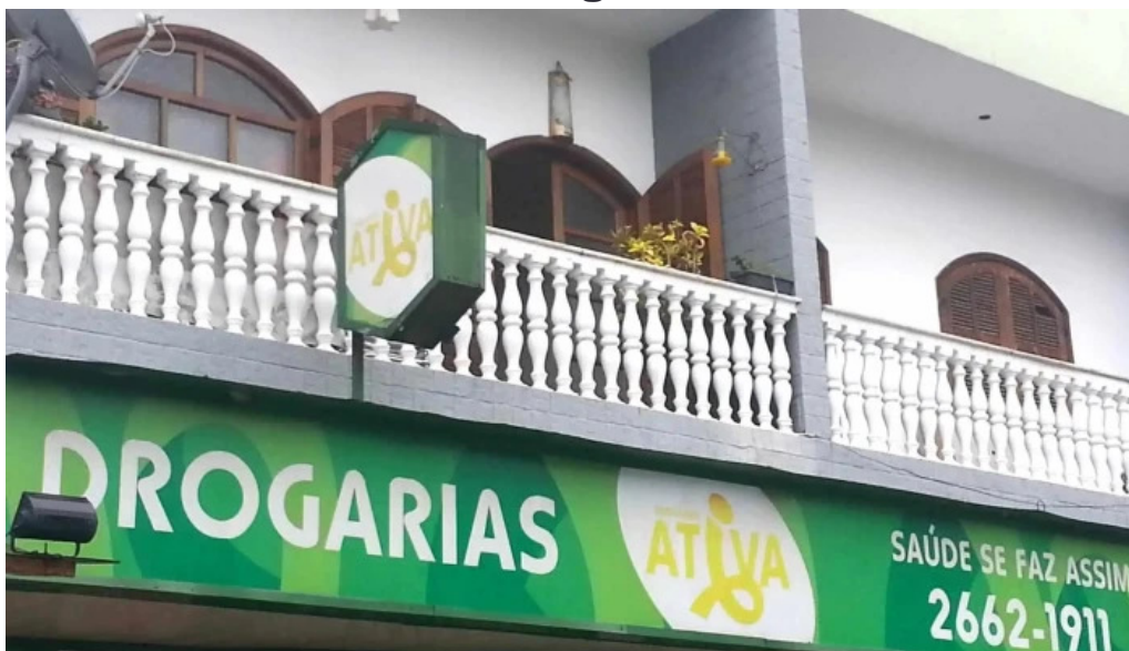
Drogaria ativa tudo