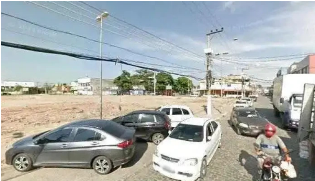
Drogaria ativa street view e 360deg