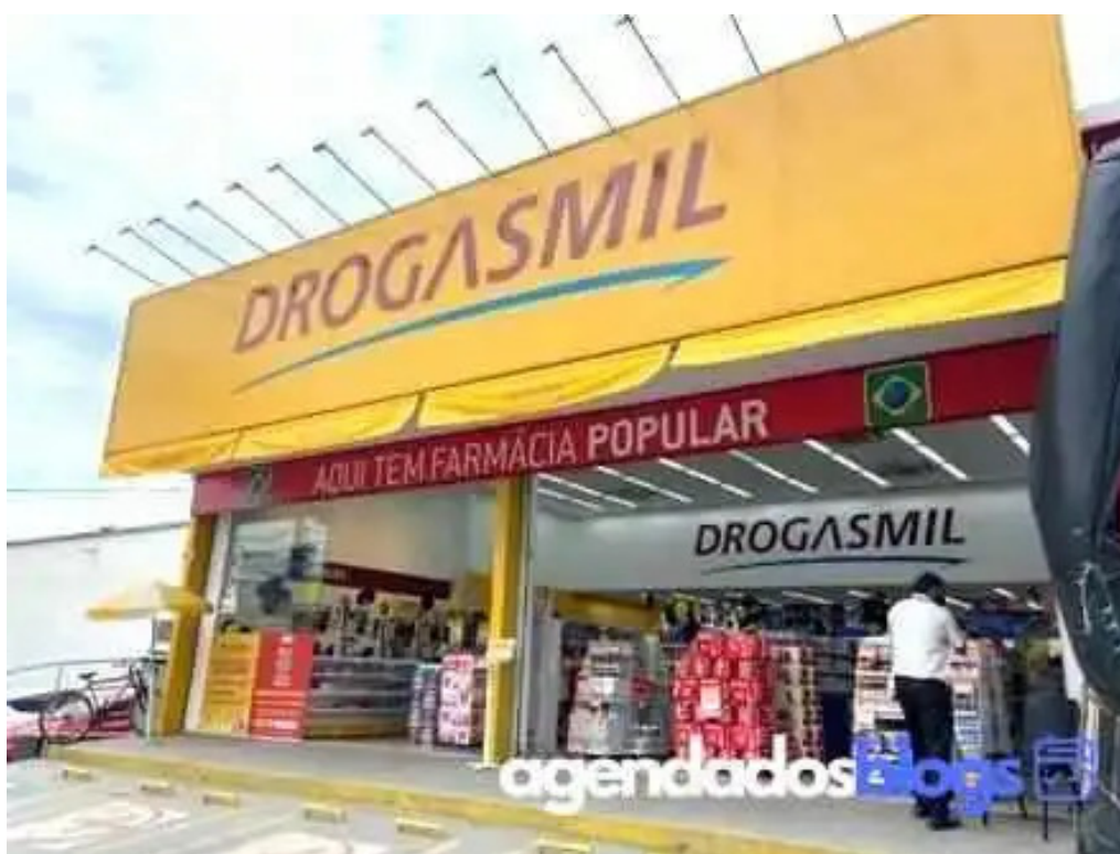
Drogasmil wona medicamentos remedios generico belford roxo rj belford roxo