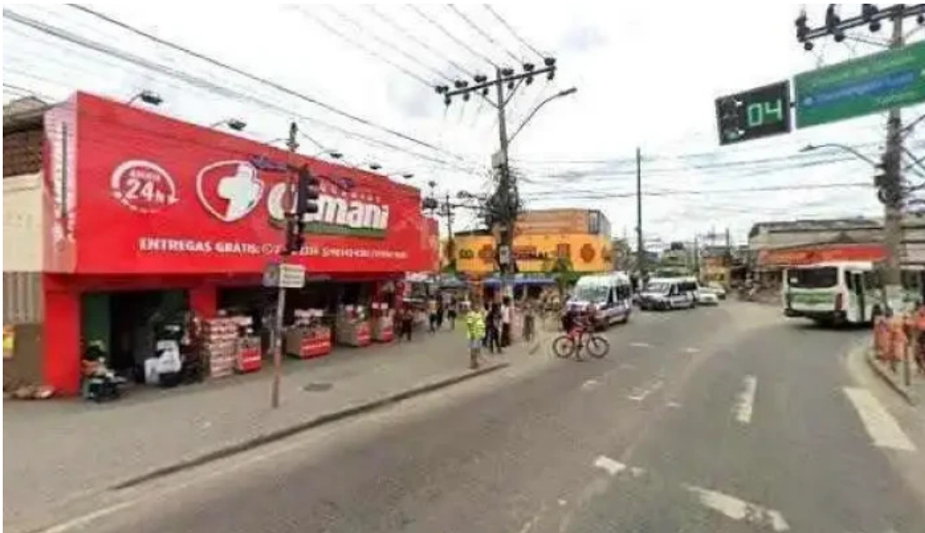
Drogasmil wona medicamentos remedios generico belford roxo rj street view e 360deg