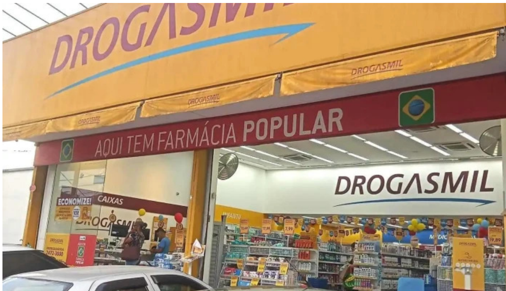
Drogasmil wona medicamentos remedios generico belford roxo rj tudo