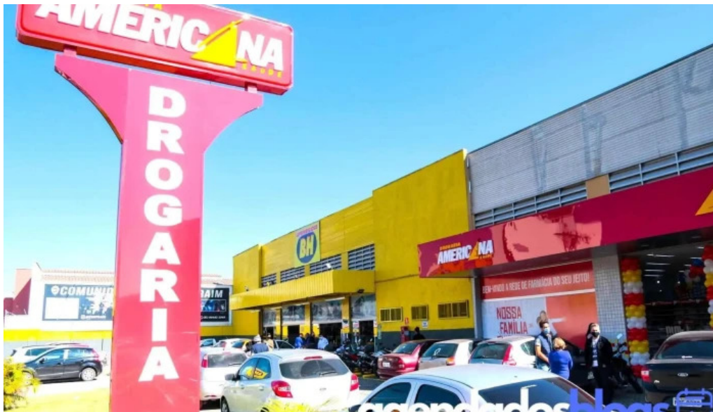
Drogaria americana inga betim mg tudo