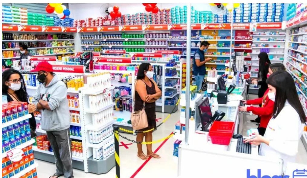
Drogeria americana inga betim mg do proprietario