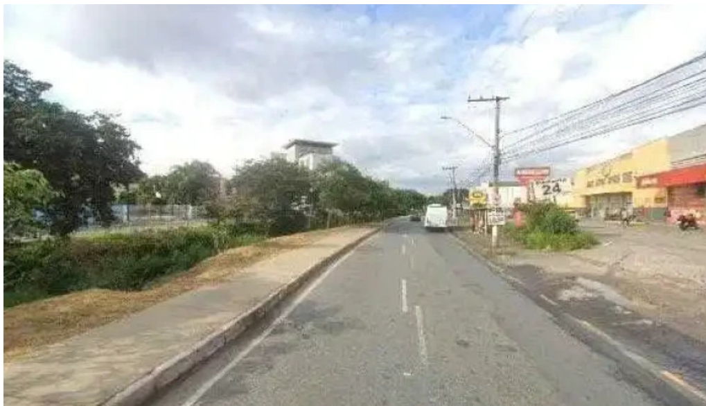
Drogaria americana inga betim mg street view e 360deg