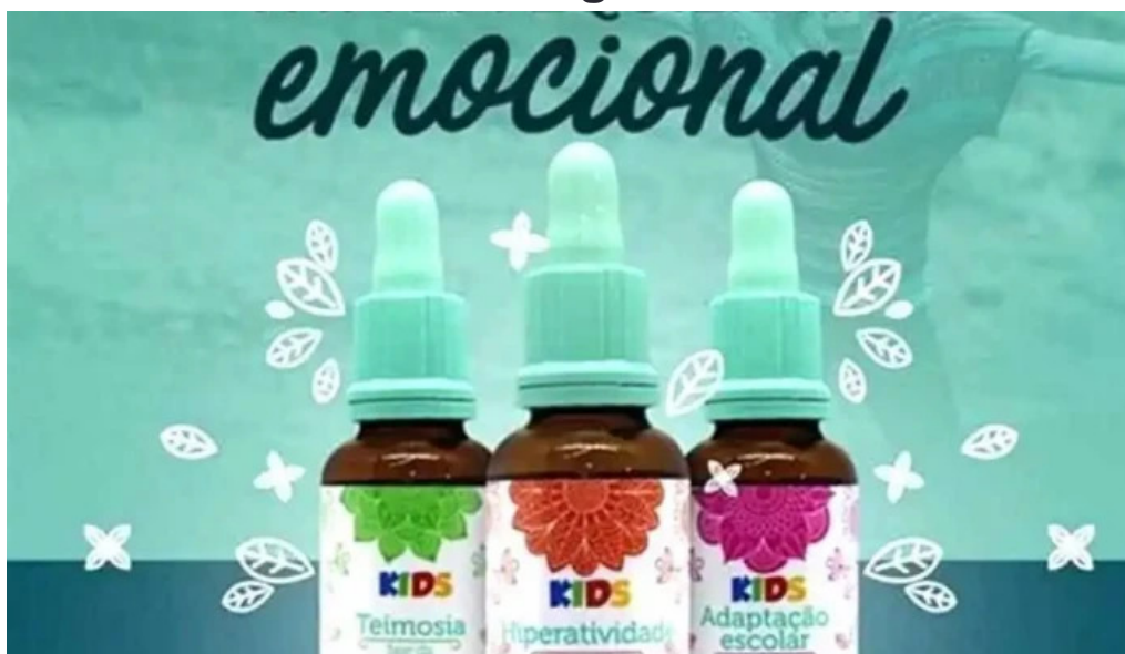
Arte e vida farmacia de manipulacao Ltda tudo