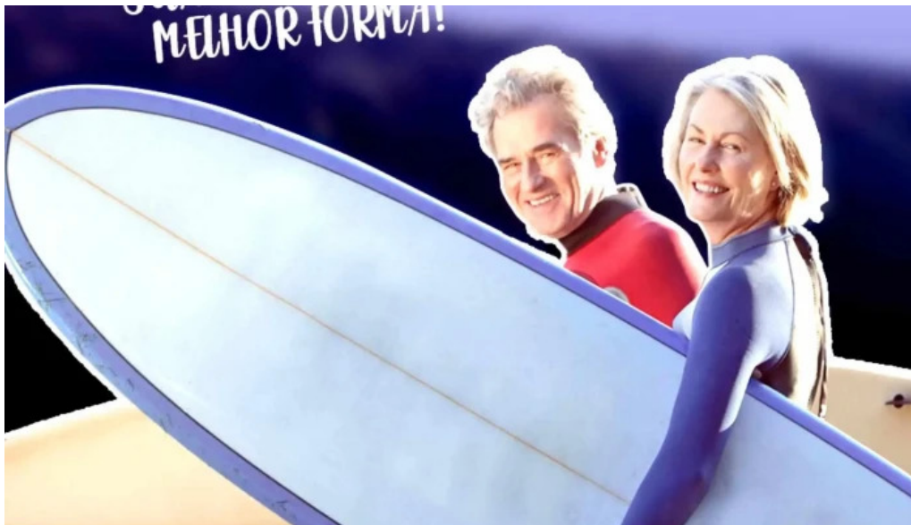
Arte e vida farmacia de manipulacao ltda do proprietario