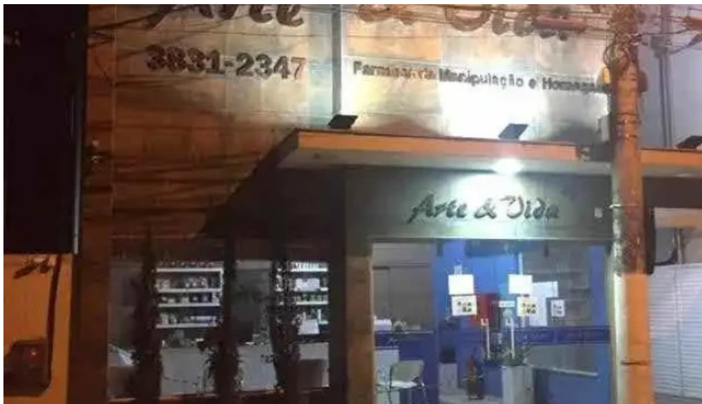
Arte e vida farmacia de manipulacao ltda bom jesus do itabapoana