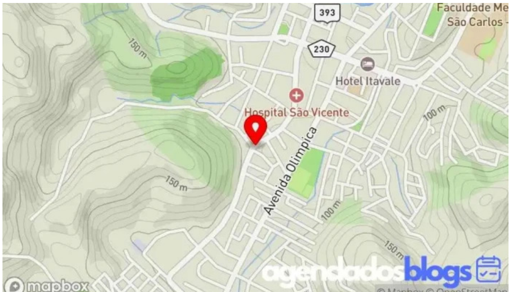
Drogaria b farma mapa