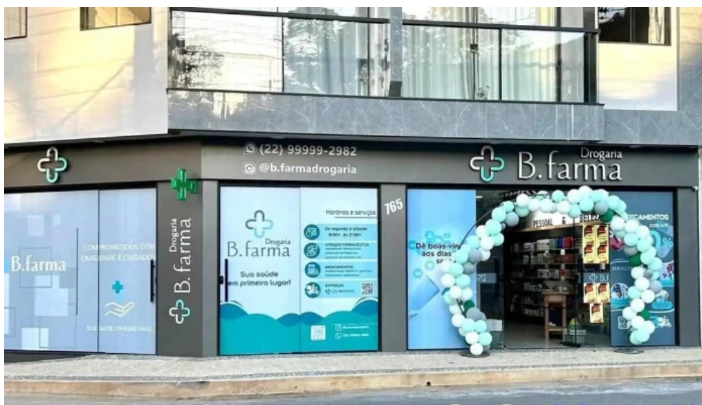
Drogaria b farma bom Jesus do itabapoana