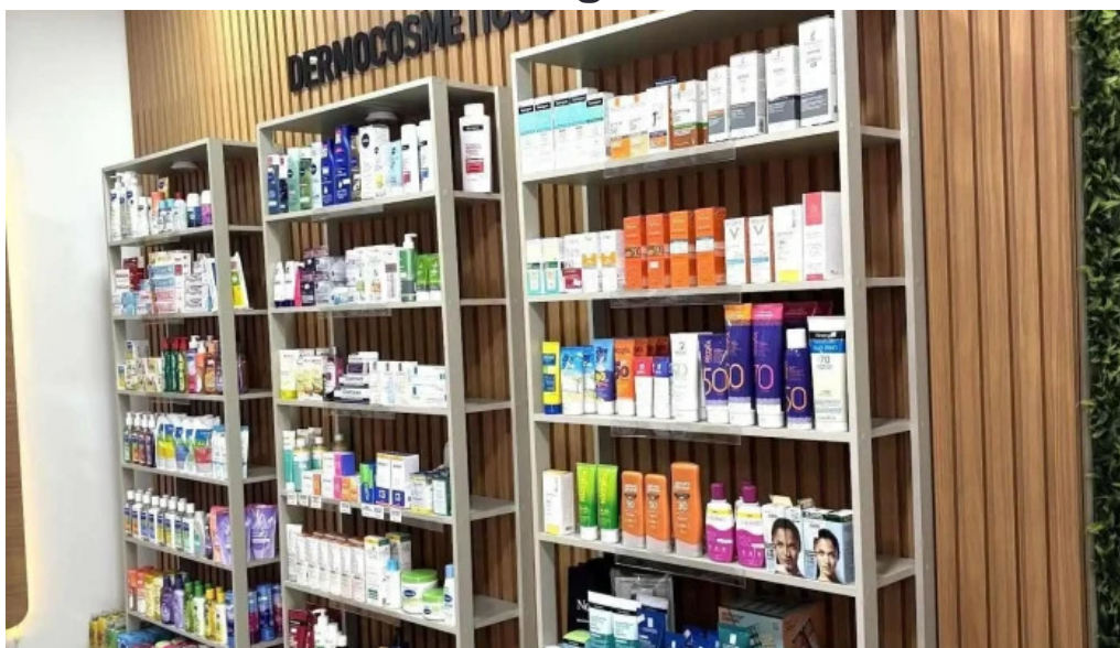
Drogaria b farma tudo