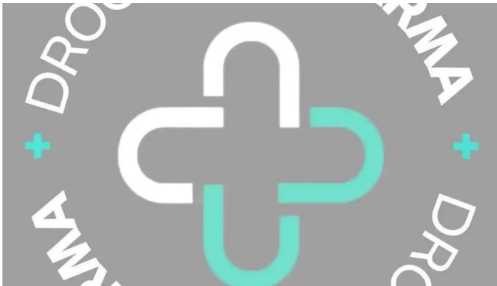
Drogaria b farma mais recentes