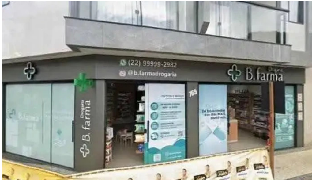
Drogaria b farma street view e 360deg