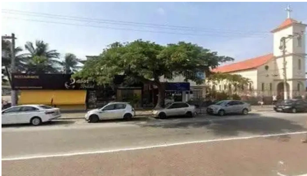
Drogaria nova sao cristovao ltda me street view e 360deg