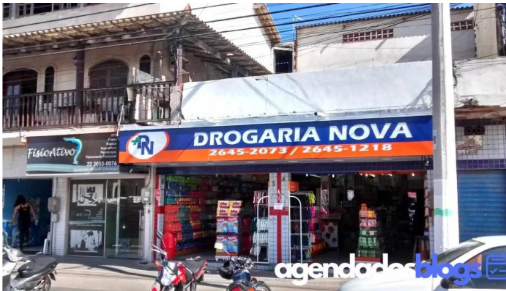
Drogaria nova sao cristovao ltda me tudo