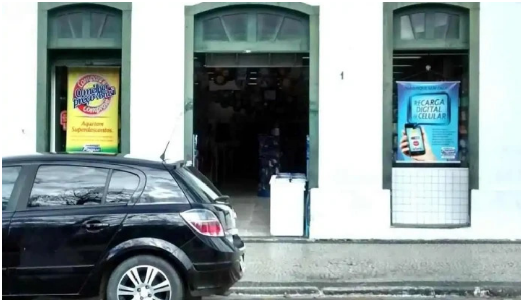
Farmacia pague menos tudo