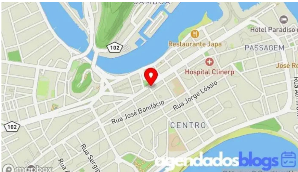
Farmacia pague menos mapa