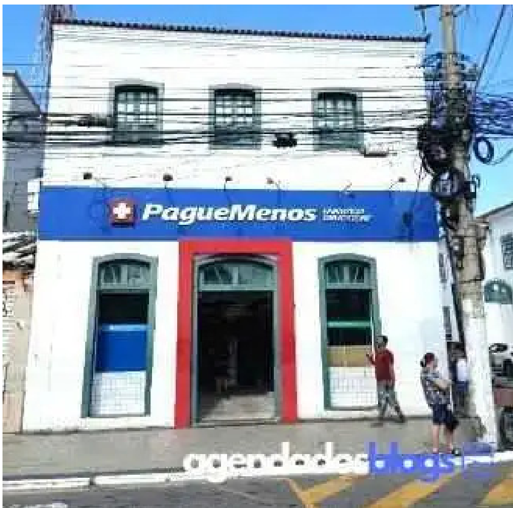
Farmacia pague menos cabo frio