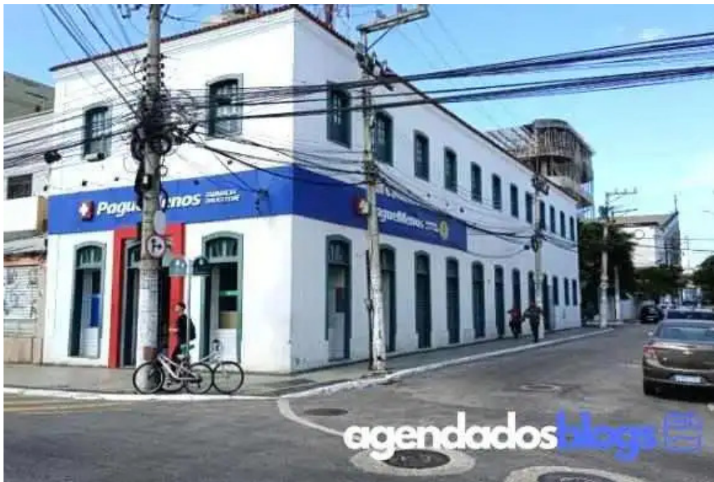
Farmacia pague menos do proprietario