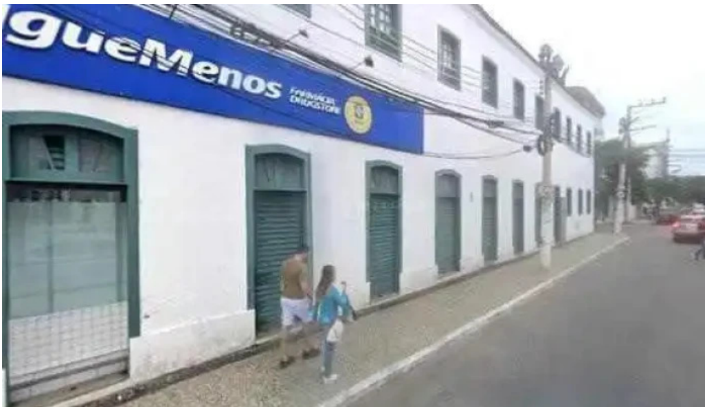
Farmacia pague menos street view e 360deg