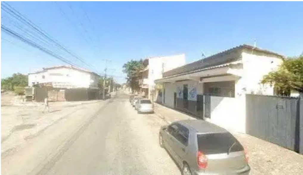
Farmacia popular farmacenter street view e 360deg