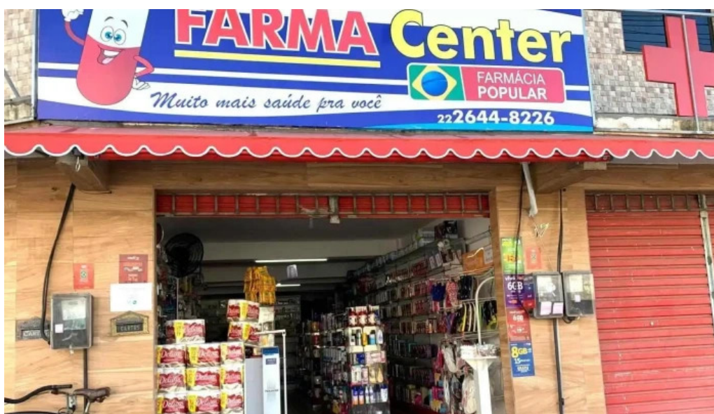
Farmacia popular farmacenter do proprietario