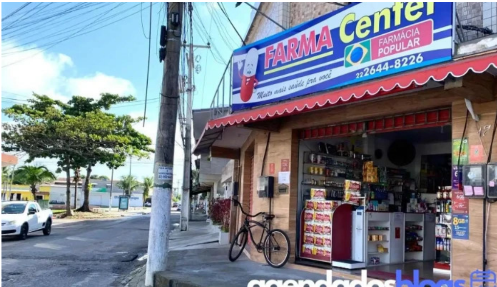
Farmacia popular farmacenter tudo