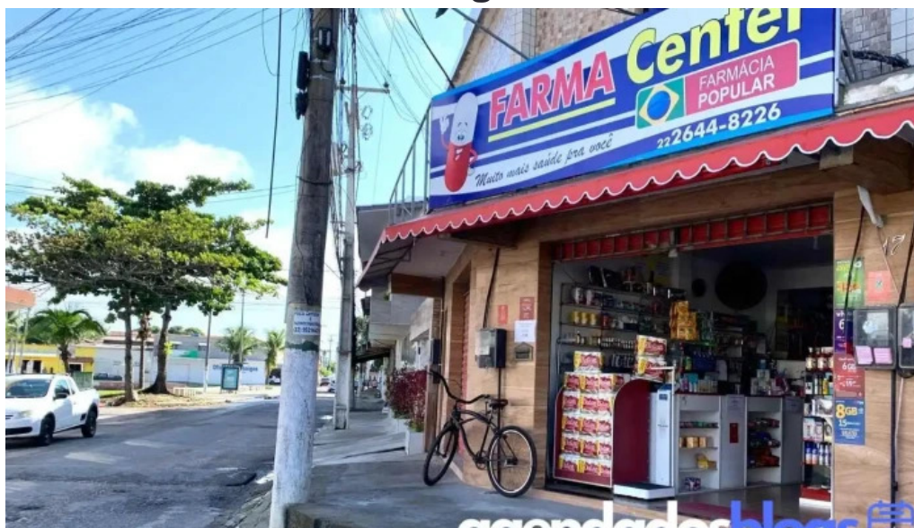
Farmacia popular farmacenter cabo frio