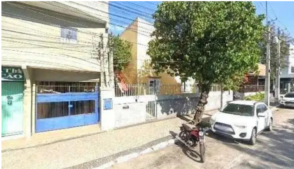
Homeopatia assumpcao street view e 360deg