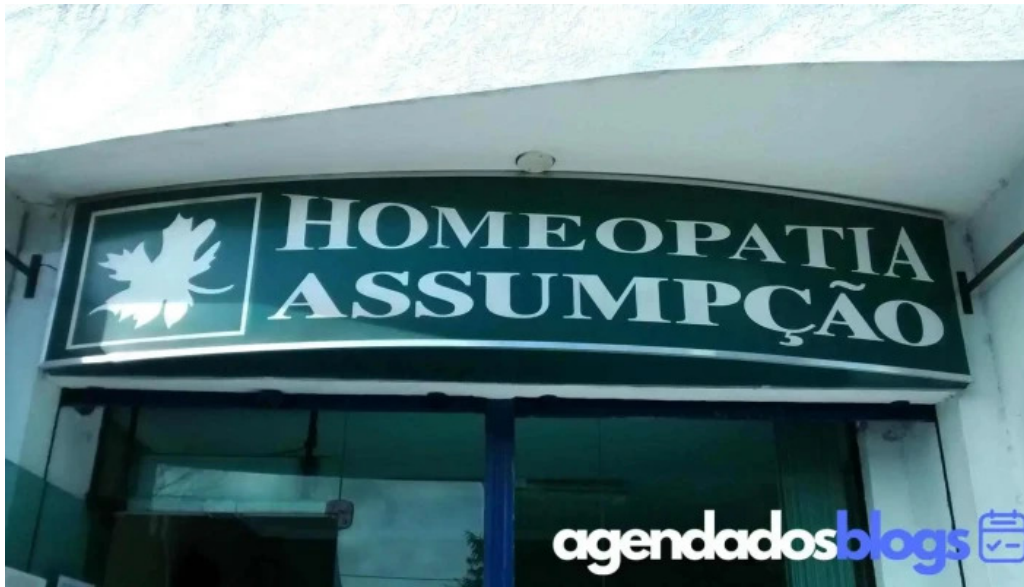
Homeopatia assumpcao tudo