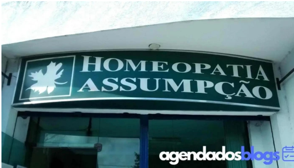
Homeopatia assumpcao cabo frio