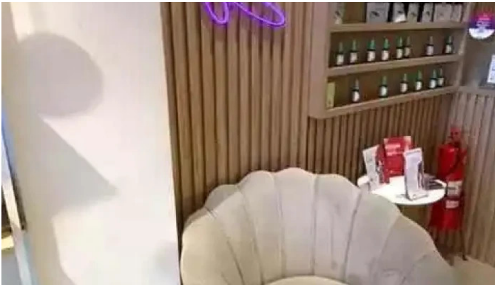
Repharma farmacia de manipulacao videos