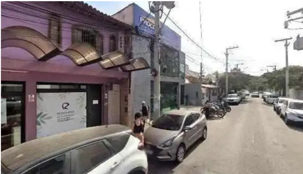
Repharma farmacia de manipulacao street view e 360deg