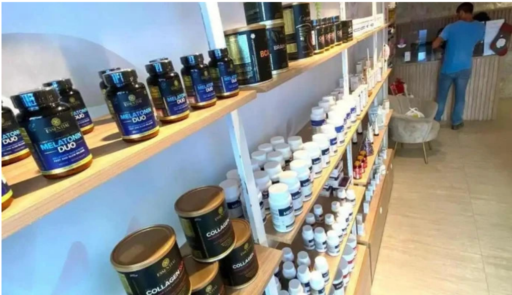
Repharma farmacia de manipulacao tudo