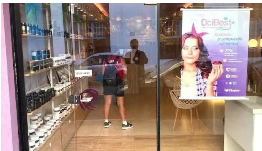
Repharma farmacia de manipulacao cabo frio