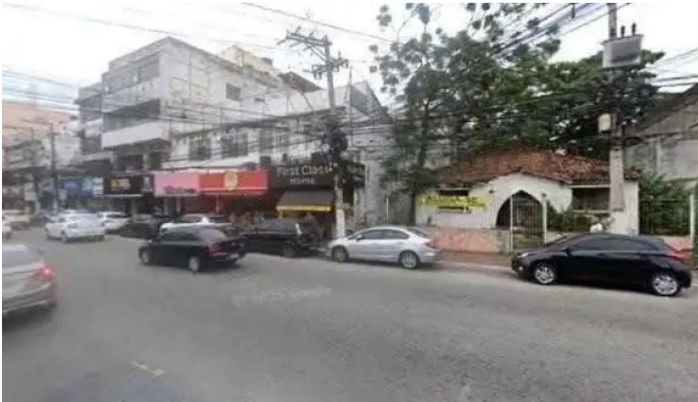
Santa lucia drogarias street view e 360deg